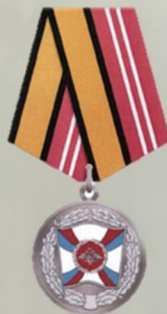
МЕДАЛЬ "ЗА УКРЕПЛЕНИЕ БОЕВОГО СОДРУЖЕСТВА"