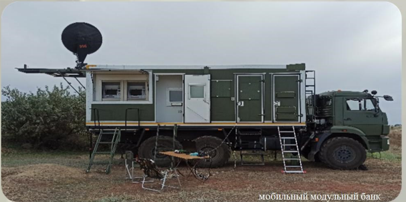
мобильный модульный банк