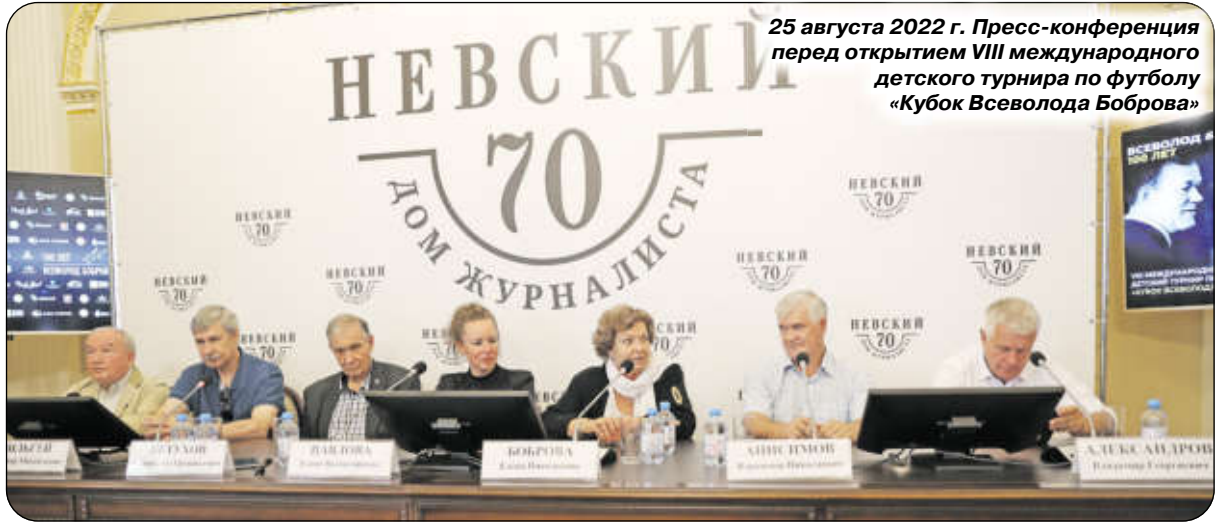
25 августа 2022 г. Пресс-конференция перед открытием VIII международного детского турнира по футболу «Кубок Всеволода Боброва»