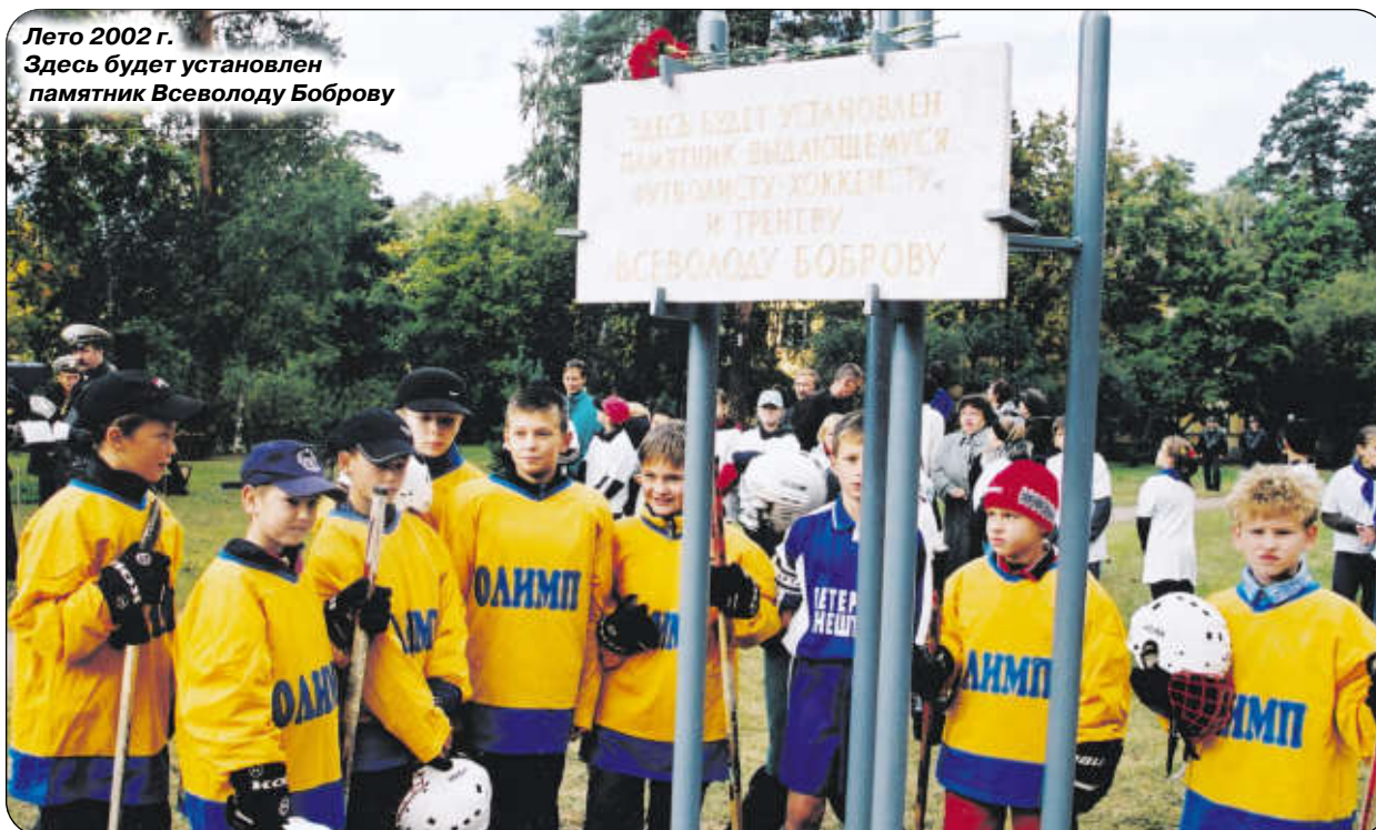
Лето 2002 г. Здесь будет установлен памятник Всеволоду Боброву