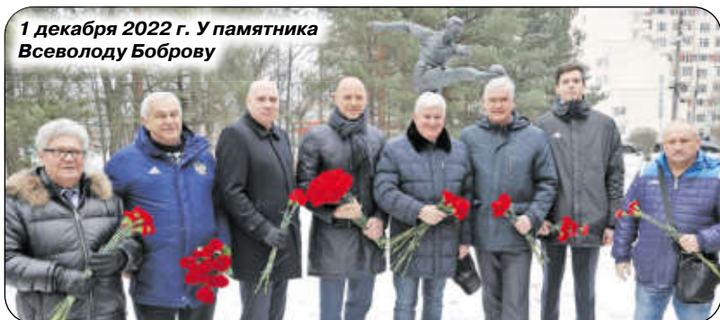
1 декабря 2022 г. У памятника Всеволоду Боброву