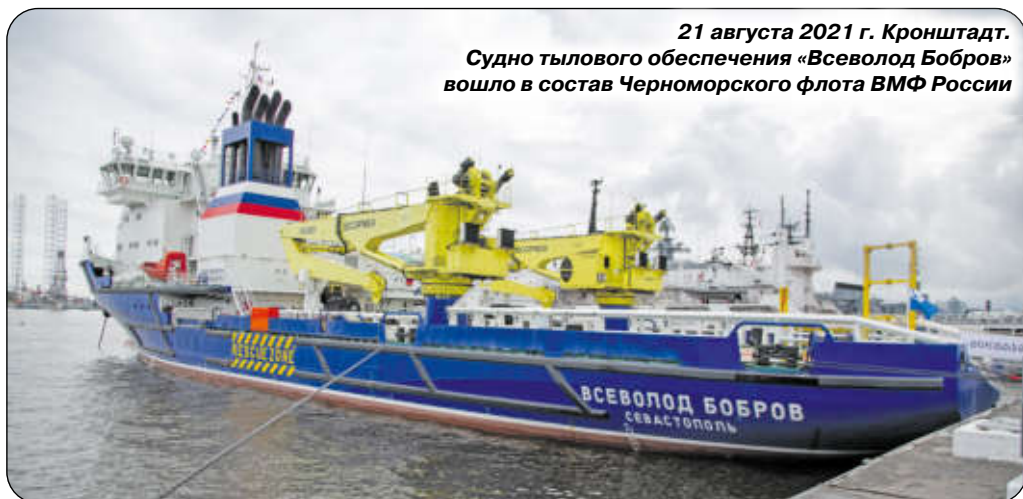
21 августа 2021 г. Кронштадт. Судно тылового обеспечения «Всеволод Бобров» вошло в состав Черноморского флота ВМФ России