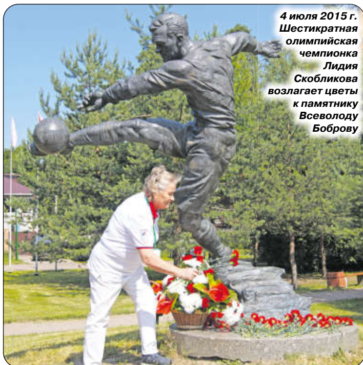
4 июля 2015 г. Шестикратная олимпийская чемпионка Лидия Скобликова возлагает цветы к памятнику Всеволоду Боброву