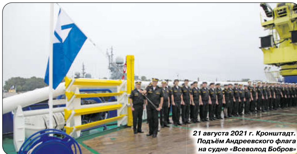
21 августа 2021 г. Кронштадт. Подъём Андреевского флага на судне «Всеволод Бобров»