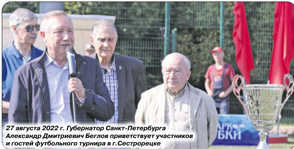
27 августа 2022 г. Губернатор Санкт-Петербурга Александр Дмитриевич Беглов приветствует участников и гостей футбольного турнира в г.Сестрорецке