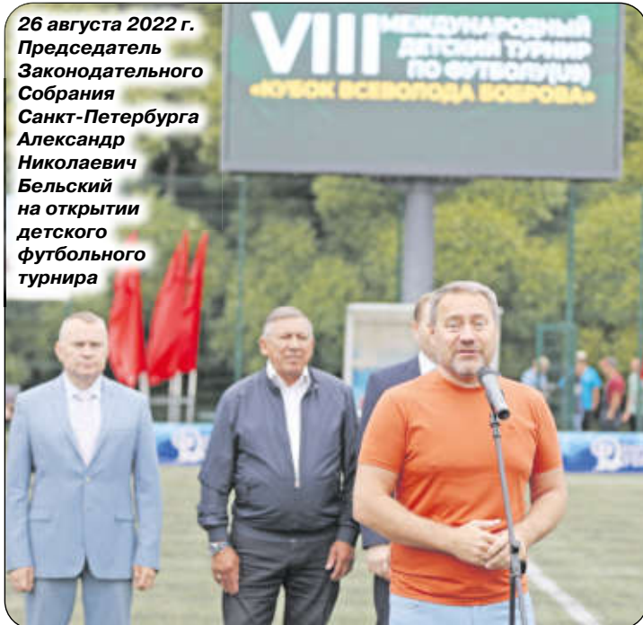
26 августа 2022 г. Председатель Законодательного Собрания Санкт-Петербурга Александр Николаевич Бельский на открытии детского футбольного турнира