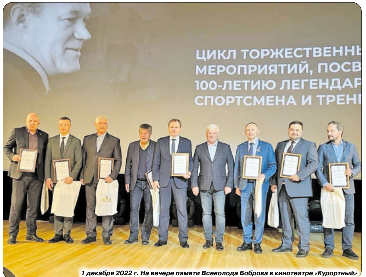
1 декабря 2022 г. На вечере памяти Всеволода Боброва в кинотеатре «Курортный»