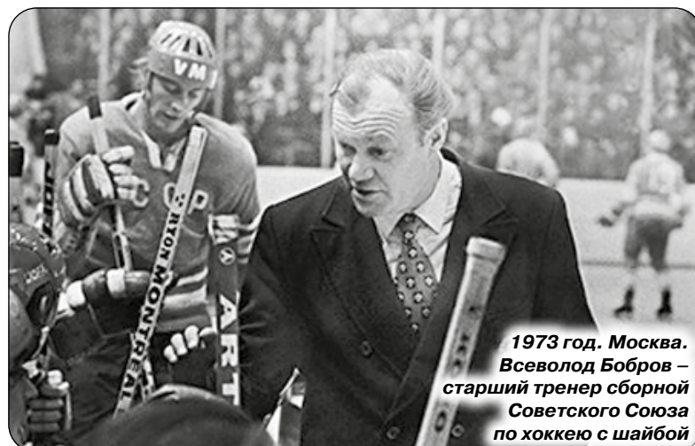
1973 год. Москва. Всеволод Бобров – старший тренер сборной Советского Союза по хоккею с шайбой