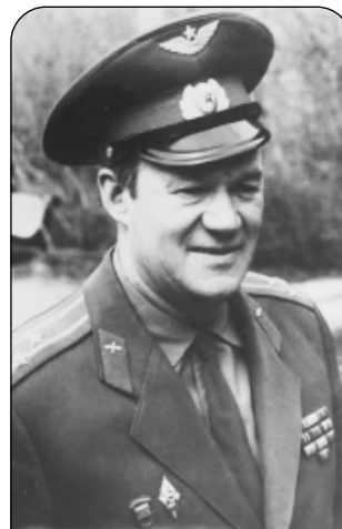
Всеволод Бобров – полковник Советской Армии