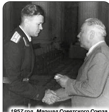
1957 год. Маршал Советского Союза Климент Ворошилов вручает Всеволоду Боброву высшую правительственную награду – орден Ленина