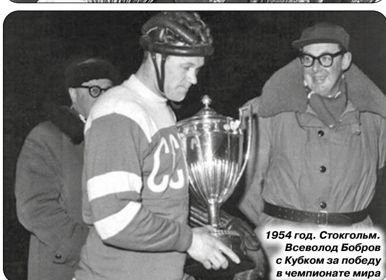
1954 год. Стокгольм. Всеволод Бобров с Кубком за победу в чемпионате мира