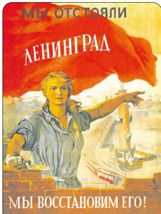
Мы отстояли Ленинград – мы восстановим его! [Изоматериал]: [плакат] / Худож. В.А.Серов. – Москва; Ленинград: Искусство, 1944.

Станислав Дорожковский, специалист по учёту музейного фонда Историко-культурного музейного комплекса в Разливе