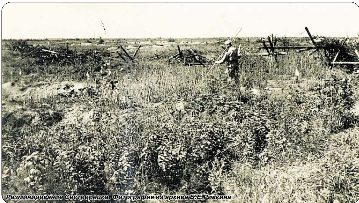
Разминирование Сестрорецка.

На этом же заседании было решено открыть первый после блокады детский сад в Сестрорецке с количеством детей 100 человек. На заседании Исполкома отмеча-