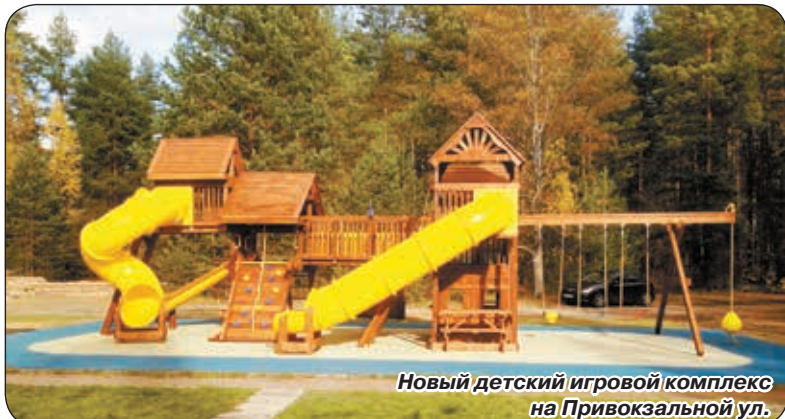
Новый детский игровой комплекс на Привокзальной ул.