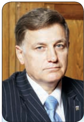
В.С.Макаров, Секретарь Санкт-Петербургского регионального отделения партии «Единая Россия», Председатель Законодательного Собрания Санкт-Петербурга

Уважаемые коллеги! Примите мои искренние поздравления с профессиональным праздником – Днём местного самоуправления.