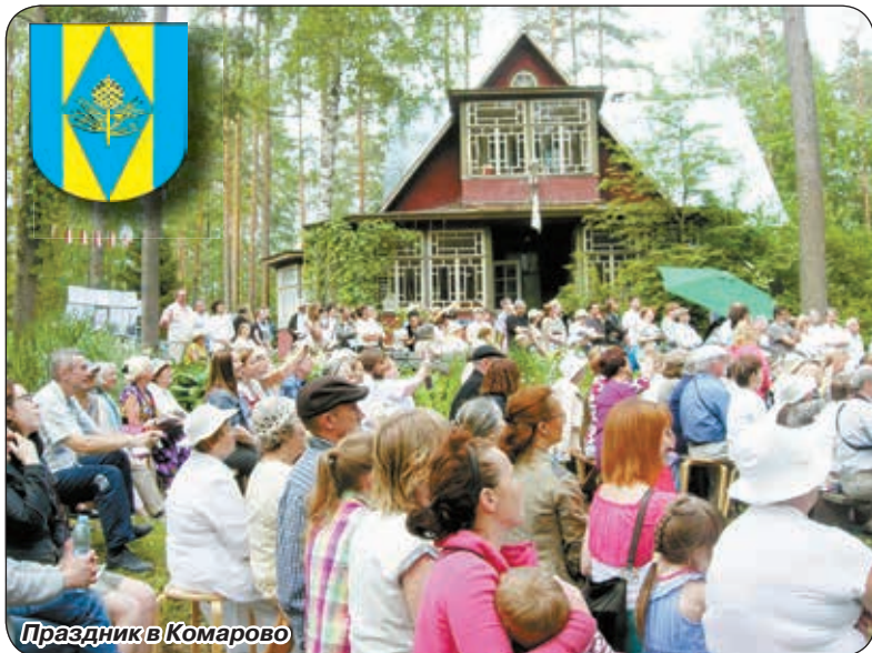
Праздник в Комарово