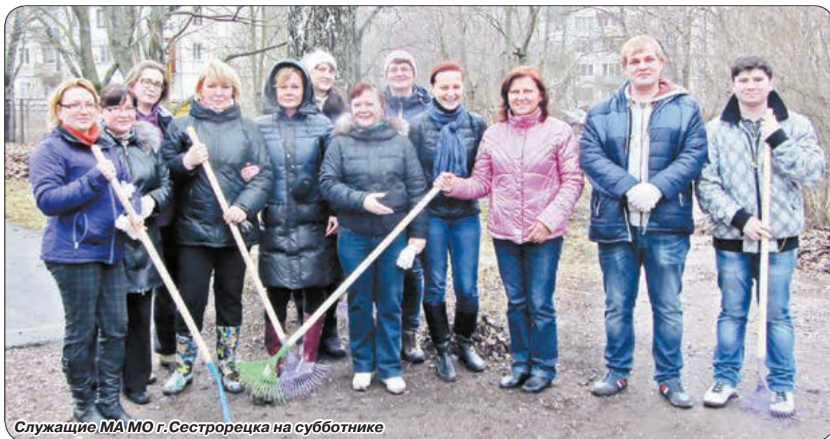
Служащие МА МО г.Сестрорецка на субботнике