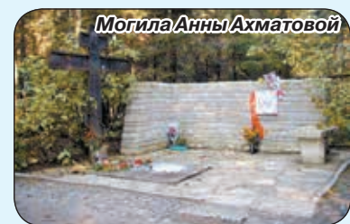
Могила Анны Ахматовой