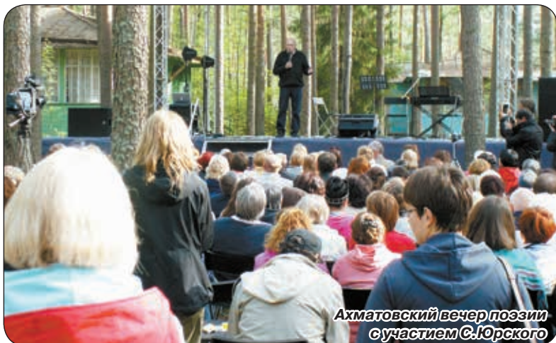
Ахматовский вечер поэзии с участием С.Юрского