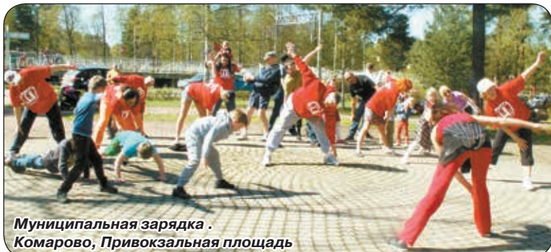
Муниципальная зарядка. Комарово, Привокзальная площадь