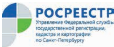
График приёма заявителей (по заявлениям и запросам, принятым

мых для окончательного завершения государственной регистрации прав, предоставления сведений, содержащихся в ЕГРП (заявлений о возобновлении государственной регистрации прав, о приёме дополнительных документов), выдача документов по заявлениям (запросам), принятым до 01.02.2015.