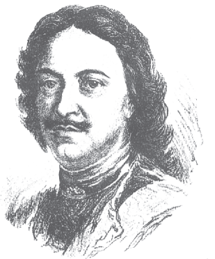
Город Сестрорецк основан в 1714 году Петром I