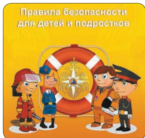
Правила безопасности для детей и подростков

Когда возникает пожар, нередко в панику бросает не только детей, но и взрослых. Но если последние хотя бы в общих чертах знают, что делать при пожаре, то школьники могут испугаться не на шутку и растеряться. Чтобы этого не было, ребёнку нужно учить тому, как вести себя при малейшем признаке пожара, чтобы спасти себя и детей помладше.