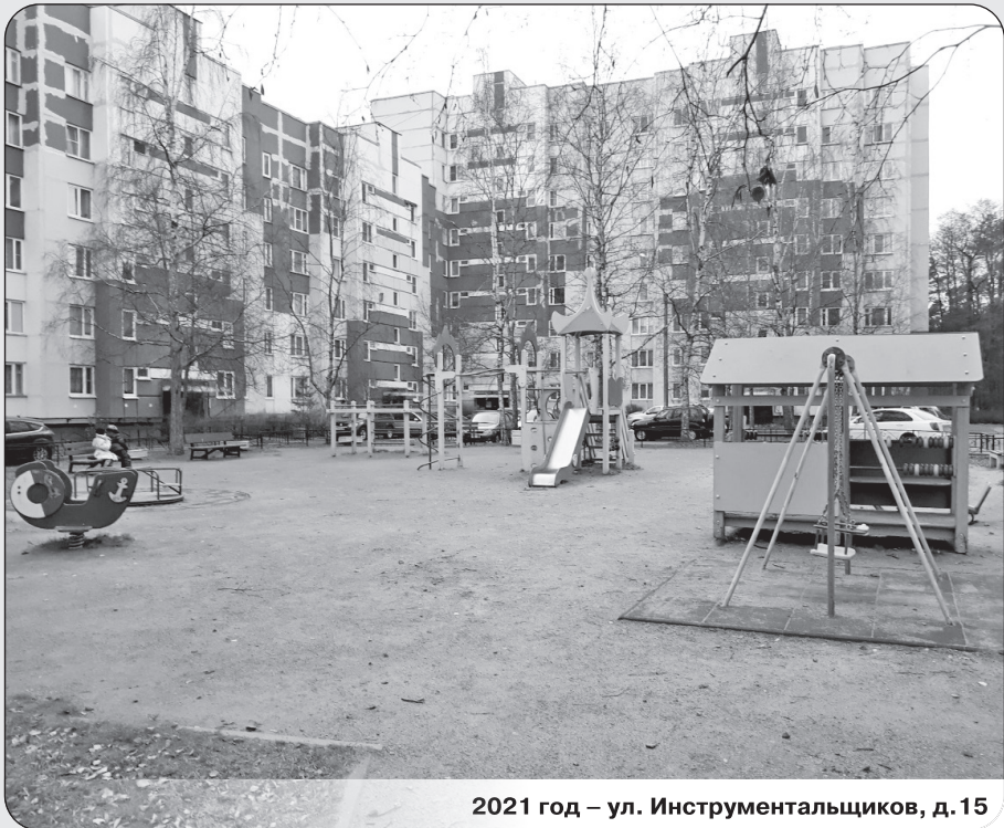
2021 год – ул. Инструментальщиков, д.15