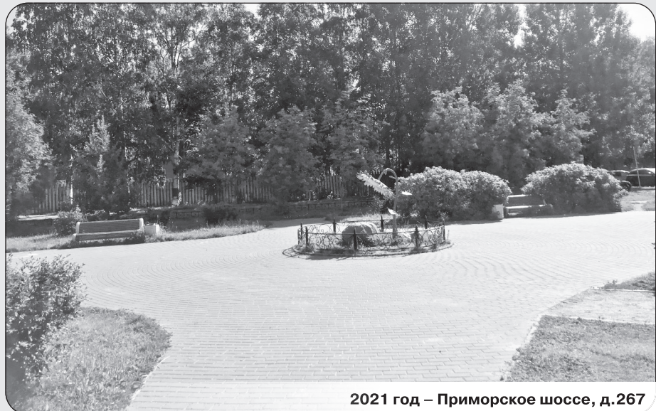
2021 год – Приморское шоссе, д.267