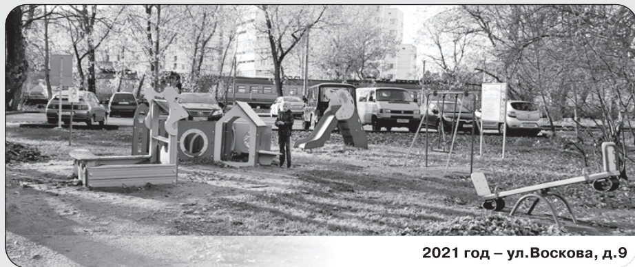
2021 год – ул.Воскова, д.9