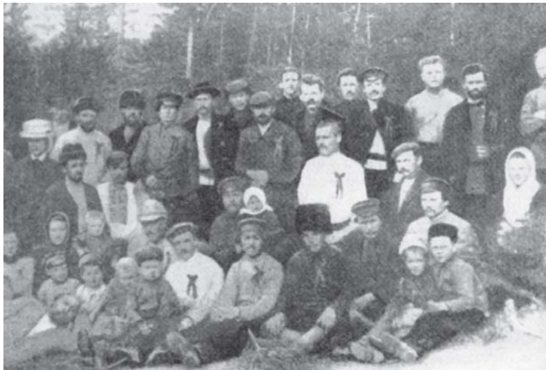
В 1905-1907 годах полиция произвела около 300 обысков в домах сестрорецких рабочих. За участия в работе боевых дружин и в забастовках было арестовано около 200 человек. На снимке: группа сестрорецких рабочих в ссылке в селе Самарово Тобольской губернии.

Однако революционная волна пошла на убыль и началась расправа с бунтовщиками. И только особое приграничное положение завода и при поддержке со стороны жителей финской стороны (Оллила, Куоккала, Терийоки) подавить свободный дух сестроречан не удалось.