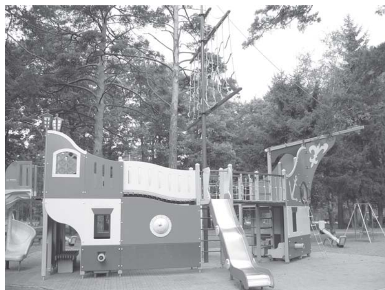
Ул. Инструментальщиков, сквер

НОМИНАЦИЯ «ЛУЧШИЙ ДВОР» 2 место (Приморское шоссе, д.д. 342 – 348)