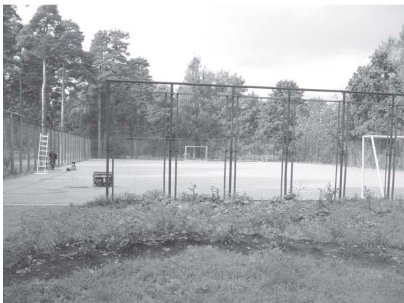
Ул. Инструментальщиков, сквер

Муниципальное образование Сестрорецк стало призером сразу в трех номинациях.