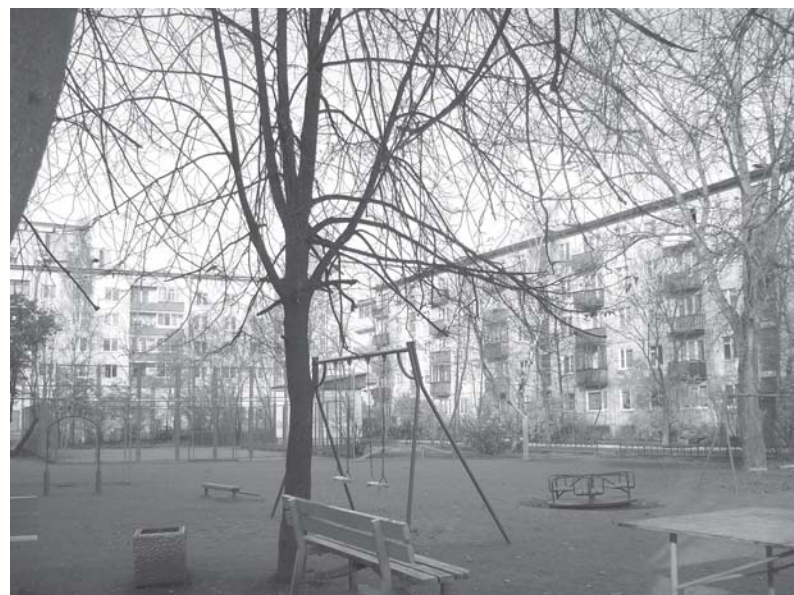
Приморское шоссе, д.д. 342 – 348

Эти и многие другие объекты благоустройства выполнены согласно адресным программам Муниципального Совета Сестрорецка на 2008 год. Как и во всех муниципалитетах Санкт-Петербурга они составлены по заявкам жителей. Принцип здесь прост — чем больше поступит предложений со стороны граждан, проживающих в том или ином дворе, тем быстрее эта