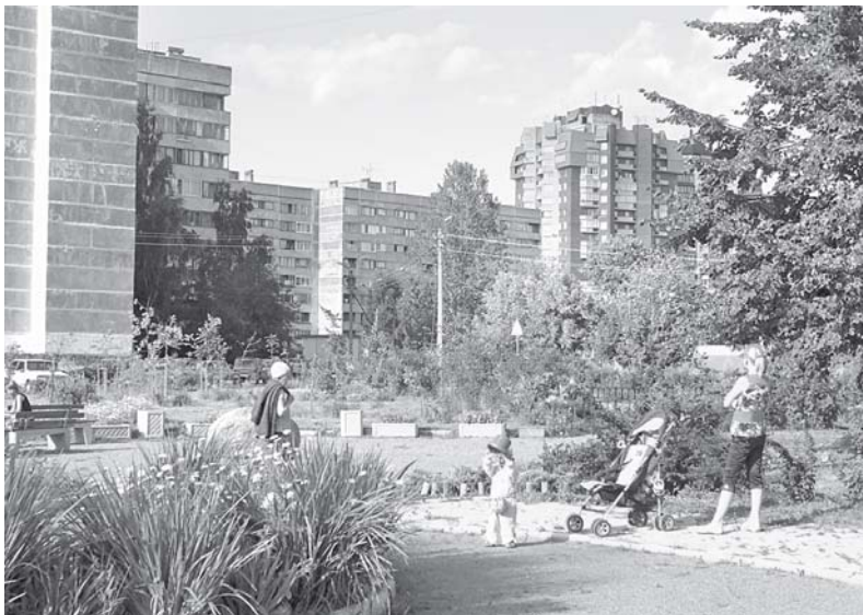
Сквер у дома 14-а по ул. Токарева