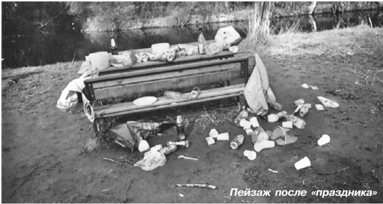
Пейзаж после «праздника»