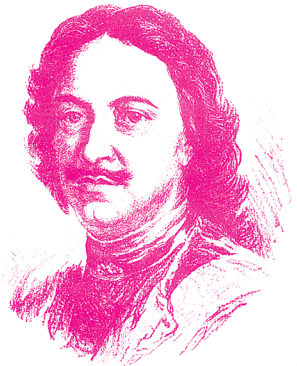
Город Сестрорецк основан в 1714 году Петром I

Перепись — это летопись России, ее история. Ее результаты адресованы не только нам, но и тем, кто будет жить после нас