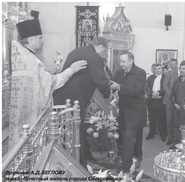
Вручение А.Д. БЕГЛОВУ знака «Почетный житель города Сестрорецка»