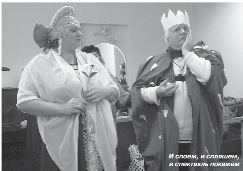
И споем, и спляшем, и спектакль покажем