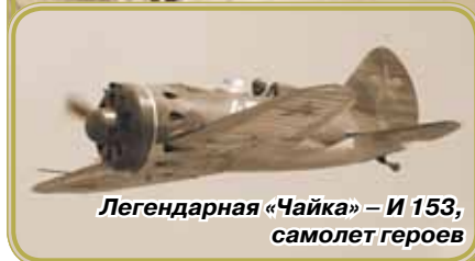
Легендарная «Чайка» – И-153, самолет героев