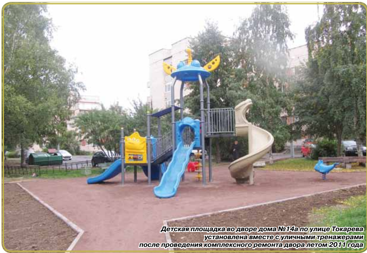
Детская площадка во дворе дома №14а по улице Токарева установлена вместе с уличными тренажерами после проведения комплексного ремонта двора летом 2011 года

Сестрорецк! Наш маленький город, на гербе которого встречаются волны Финского залива и озера Разлив. Город, который несет в себе трехсотлетнюю историю, отмеченную героическими, а порой, драматическими вехами, наполненный давними переживаниями и событиями дня сегодняшнего.