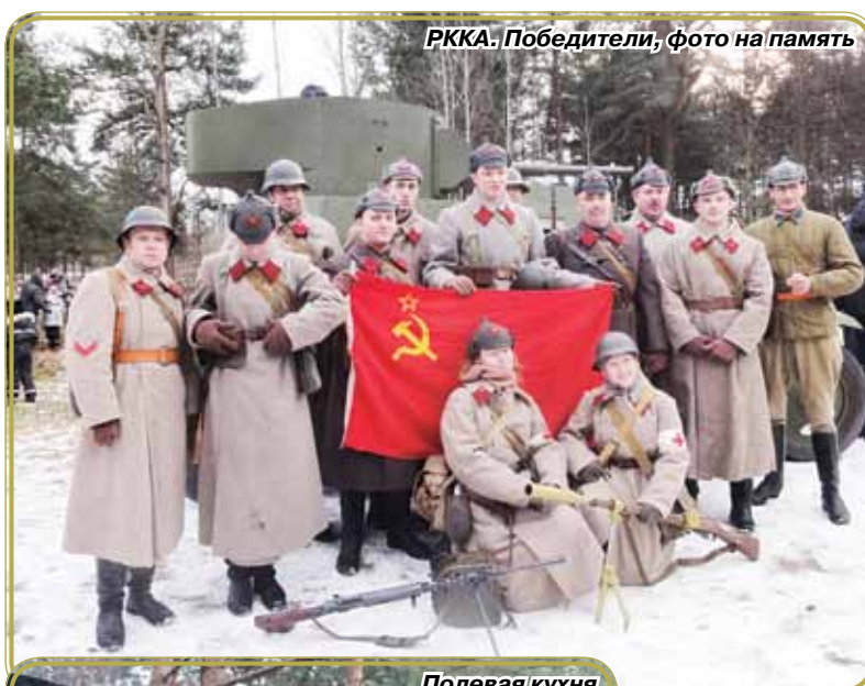
РККА. Победители, фото на память