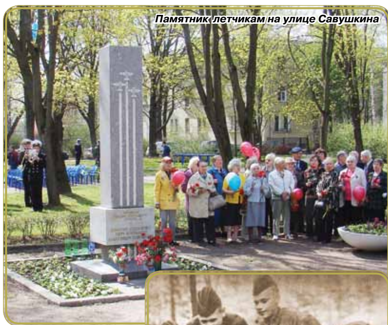
Памятник летчикам на улице Савушкина