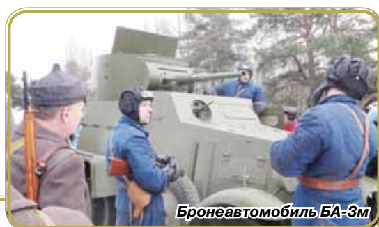
Броневый автомобиль БА-3м