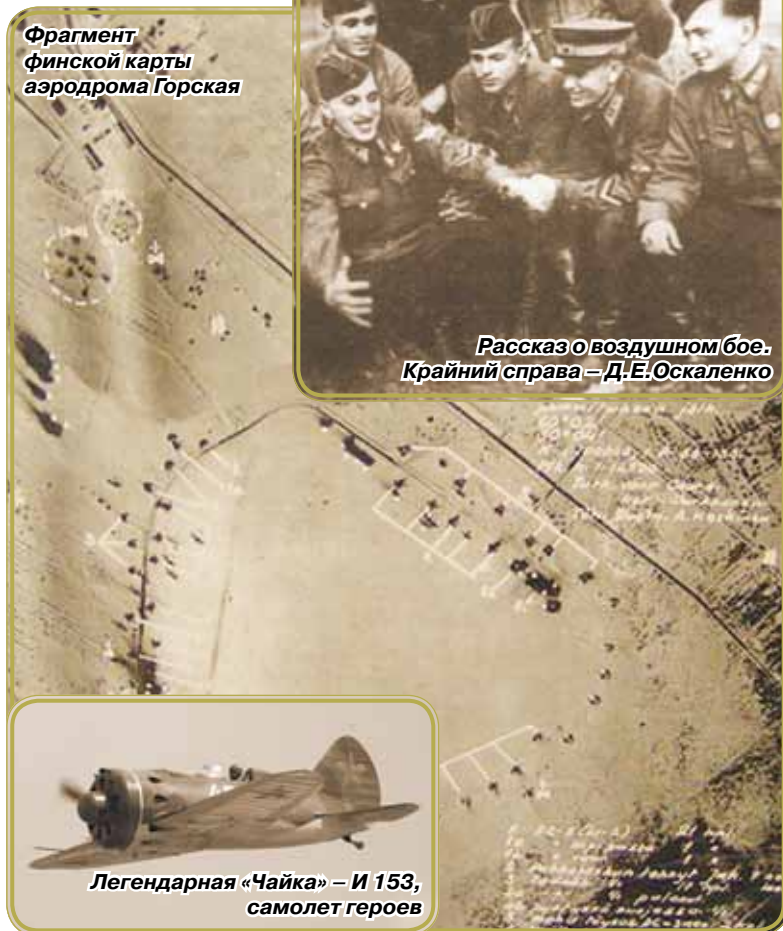
Фрагмент финской карты аэродрома Горская