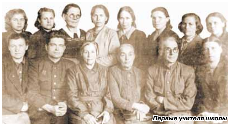
Первые учителя школы