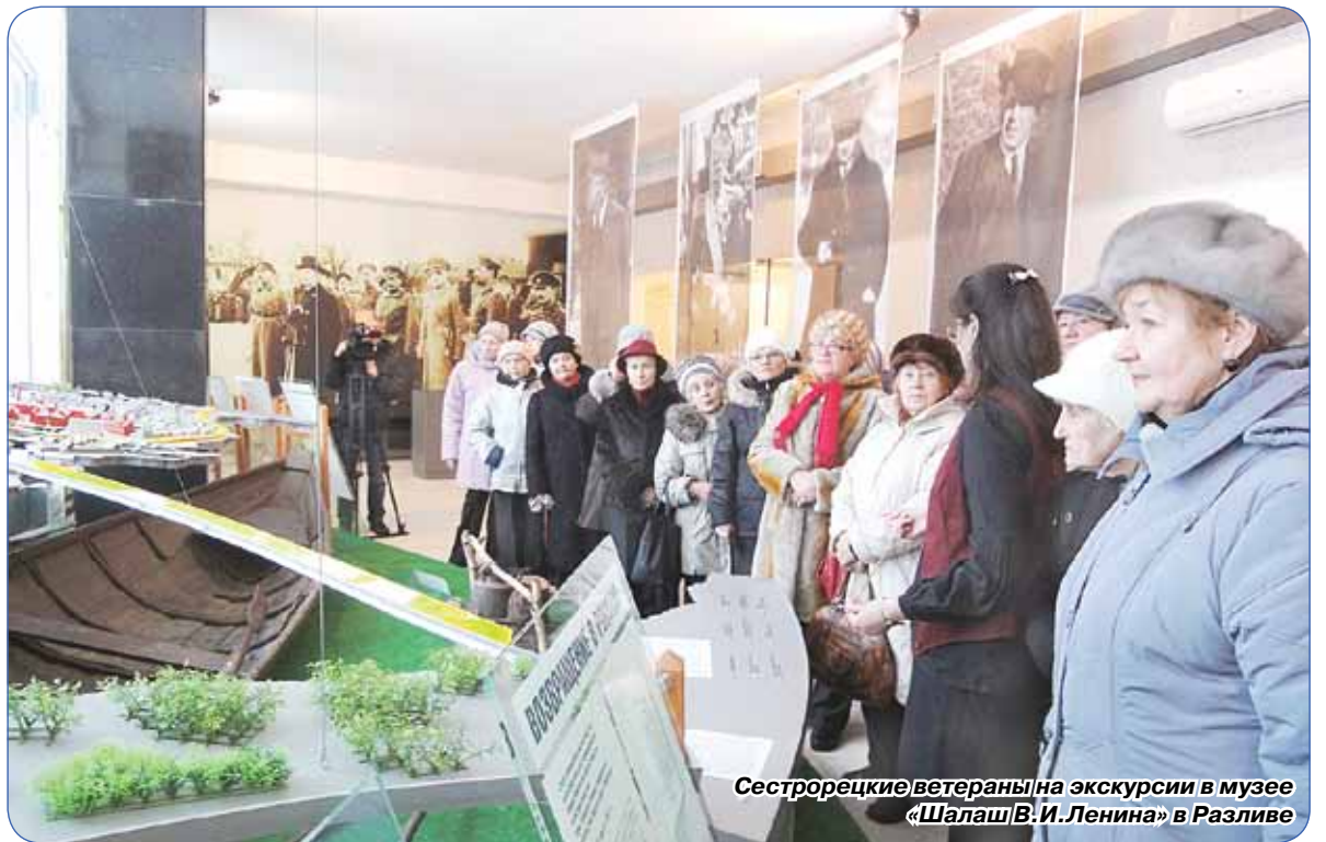
Сестрорецкие ветераны на экскурсии в музее «Шалаш В.И.Ленина» в Разливе