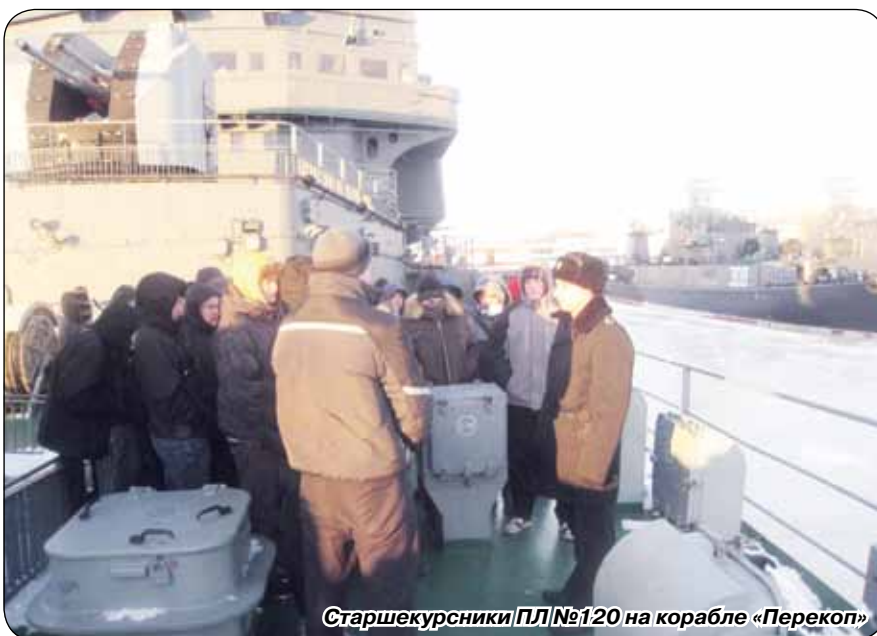
Старшекурсники ПЛ №120 на корабле «Перекоп»

Наша ярмарка стала отправной точкой для нового совместного проекта с Советом ветеранов Курортного района и Муниципальным советом города Сестрорецка. Вместе с депутатами ребята посетили многих ветеранов нашего города и поздравили их с наступающим Новым годом. В каждом доме нас ждала