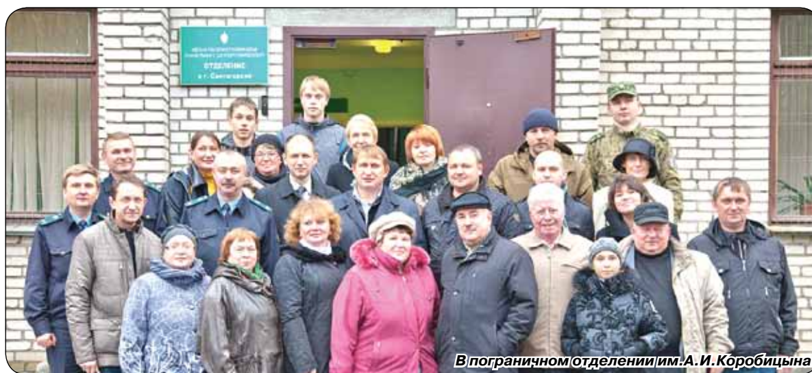
В пограничном отделении им. А.И. Коробицына