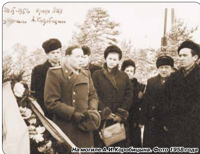
На могиле А.И. Коробицына. Фото 1958 года

21 октября в Сестрорецке и Светогорске торжественно отметили 85-летие со дня подвига Героя-пограничника А.И. Коробицына.