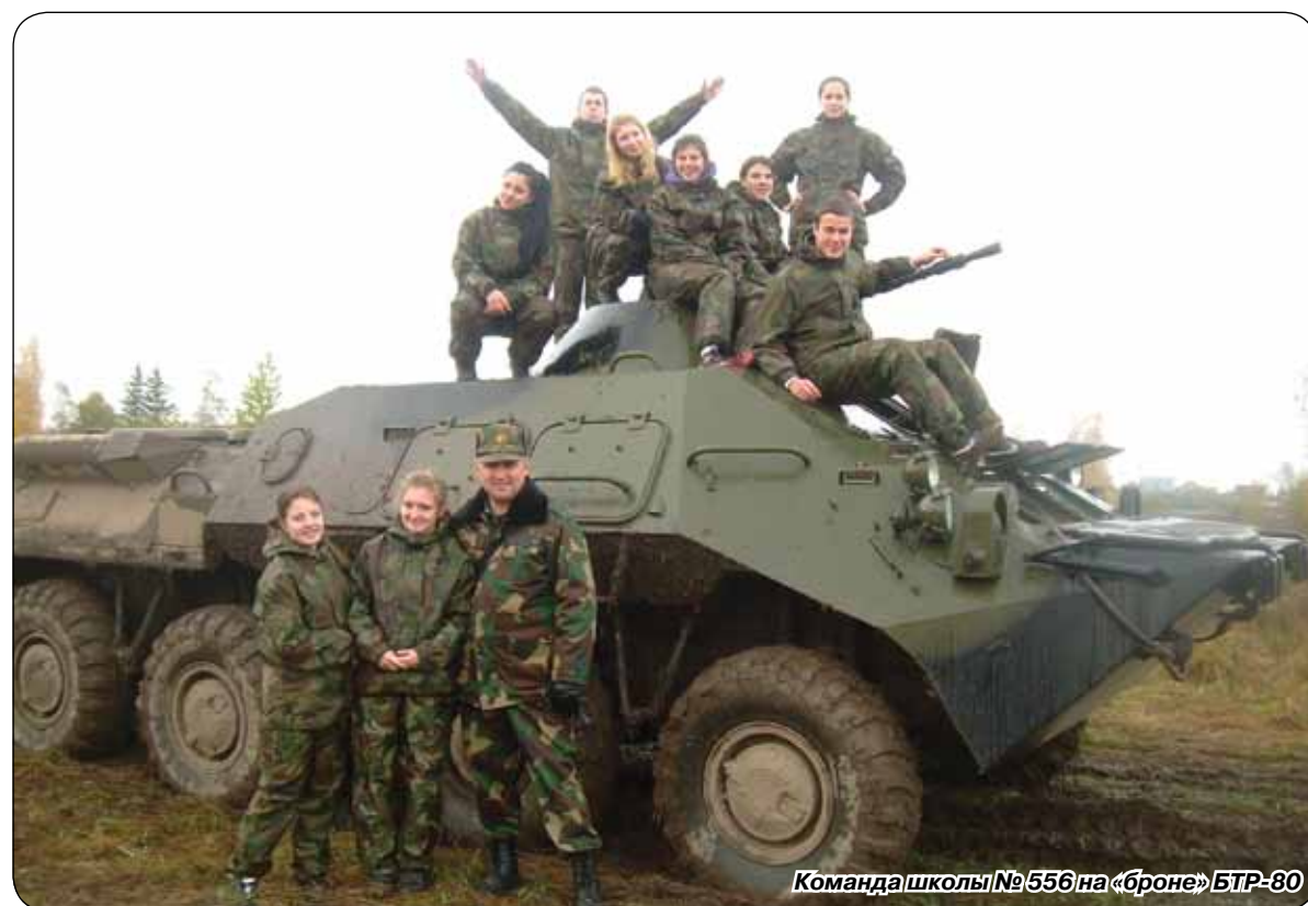
Команда школы №556 на «броню» БТР-80

А в знании об оружии помог Сестрорецк. Ребятам необходимо было не только узнать, но и рассказать о винтовке и карабине Мосина, снайперских винтовках Мосина и Токарева, а также автомате Калаш-