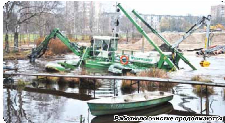
Работы по очистке продолжаются

Так как в адрес организаторов работ были высказаны претензии о недостатке информации по проекту, решено создать рабочую группу «Чистый Разлив», которая станет постоянно следить за ходом очистки и информировать об этом всех жителей. Кроме того, в ближайшее время ожидаются окончательные результаты прокурорской проверки,