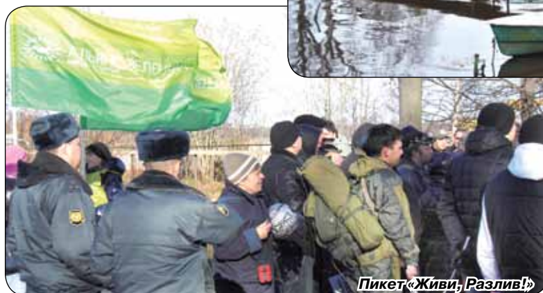
Пикет «Живи, Разлив!»