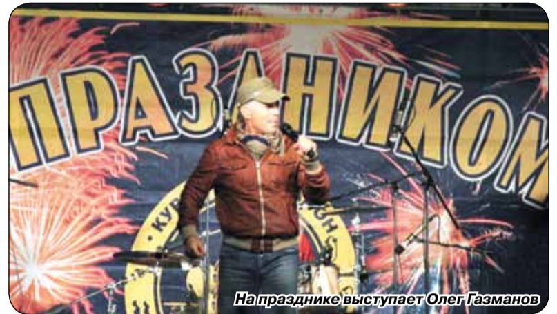
На празднике выступает Олег Газманов