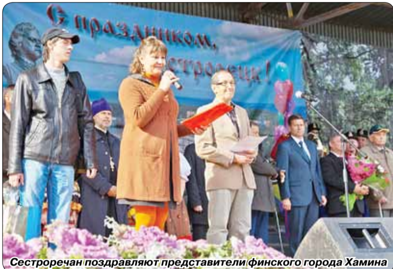
Сестрорецчан поздравляют представители финского города Хамины