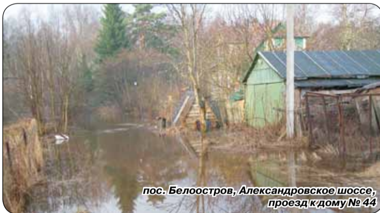
пос. Белоостров, Александровское шоссе, проезд к дому №44

В повседневной деятельности отдел осуществляет контроль за вы-