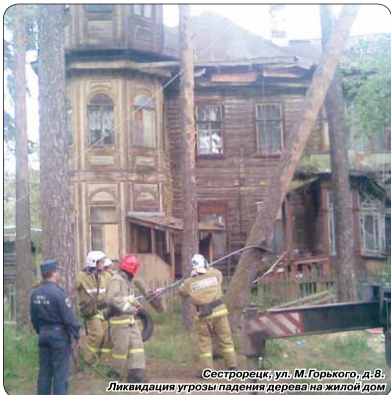
Сестрорецк, ул. М.Горького, д.8. Ликвидация угрозы падения дерева на жилой дом

Территориальный отдел по Курортному району УГЗ ГУ МЧС России по Санкт-Петербургу