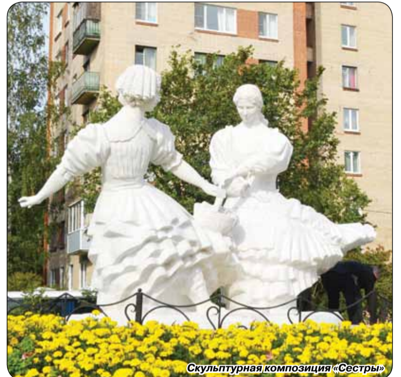
Скульптурная композиция «Сестры»