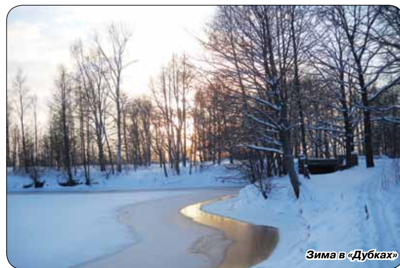
Зима в «Дубках»