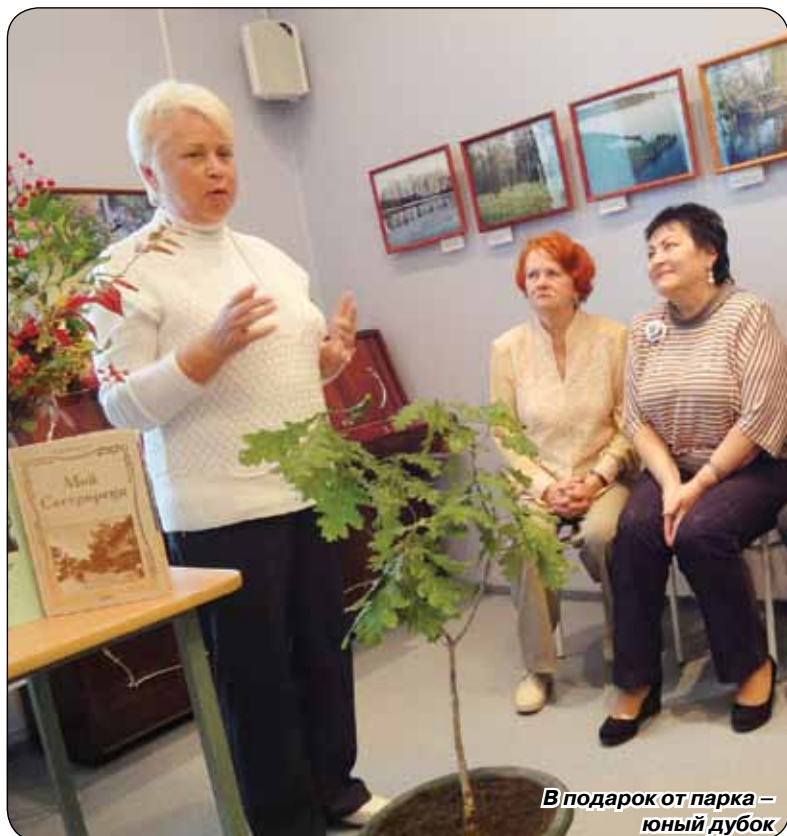
В подарок от парка – юный дубок

ском заливе или сияющие всеми оттенками синего и фиолетового россыпи фиалок? Лучше прийти и посмотреть самим, не так ли?