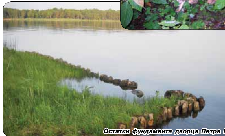
Остатки фундамента дворца Петра I

до наших дней» и многих тонких, лирических стихотворений, живописца и просто замечательного человека чувствовалось весь вечер.