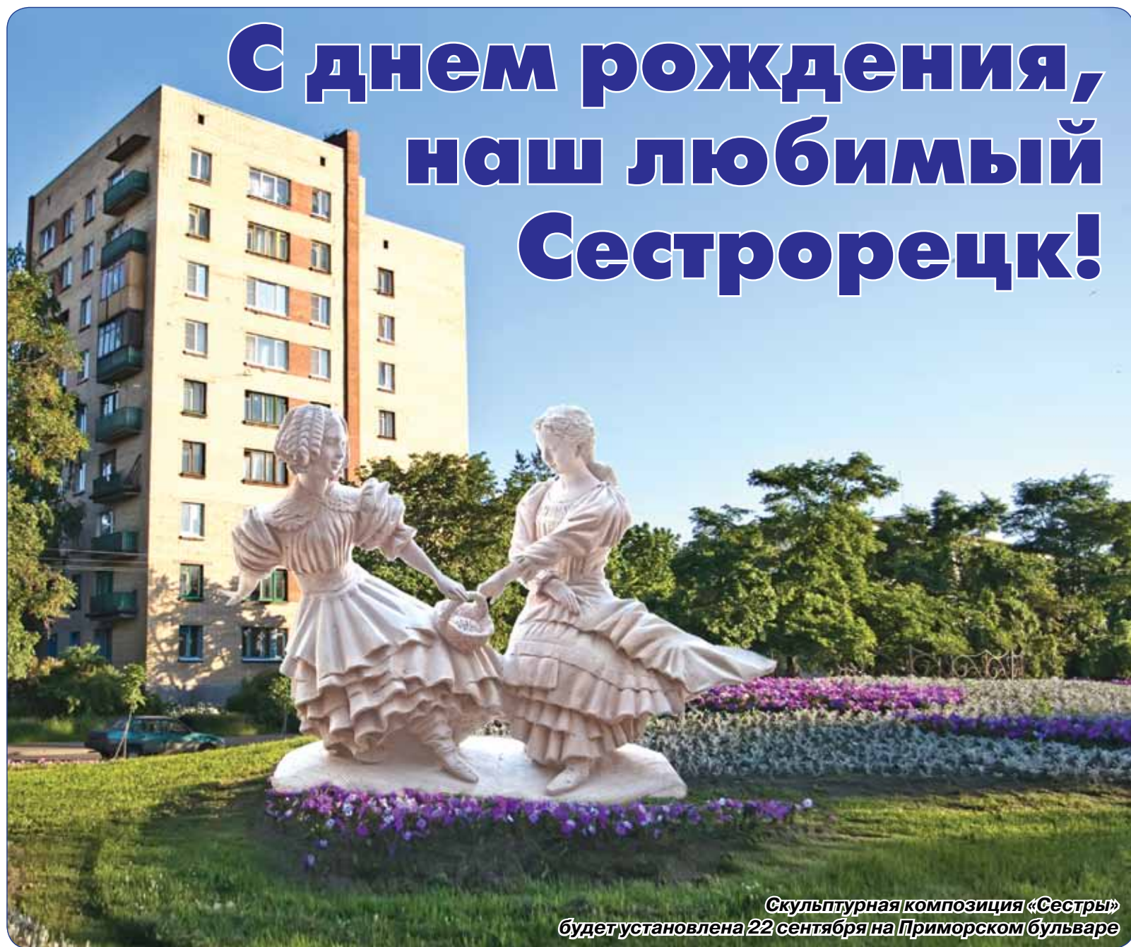
Скульптурная композиция «Сестры» будет установлена 22 сентября на Приморском бульваре