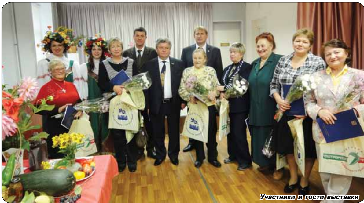
Участники и гости выставки