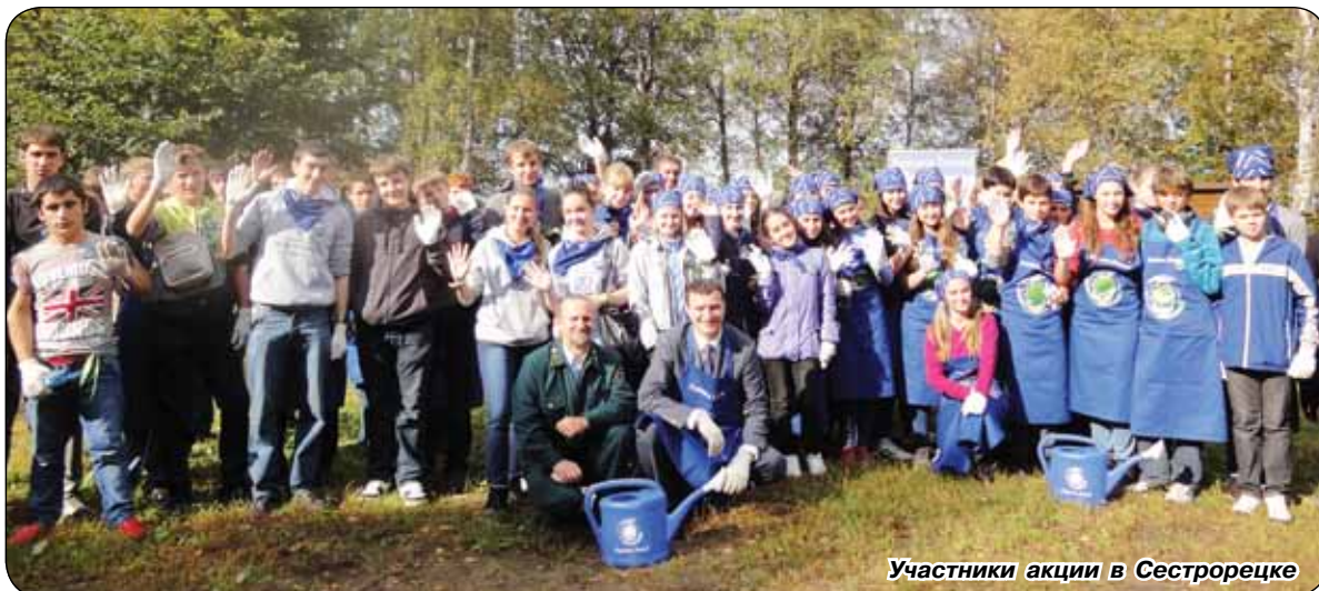
Участники акции в Сестрорецке