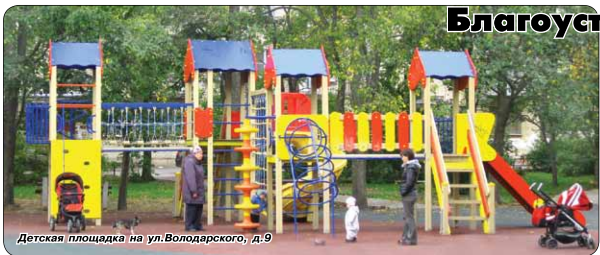
Детская площадка на ул. Володарского, д.9

В нашем городе идут большие работы по благоустройству дворовых территорий, запланированные депутатами Муниципального совета и районным жилищным агентством. По многочисленным просьбам читателей напомним, какие именно работы и где выполняются.