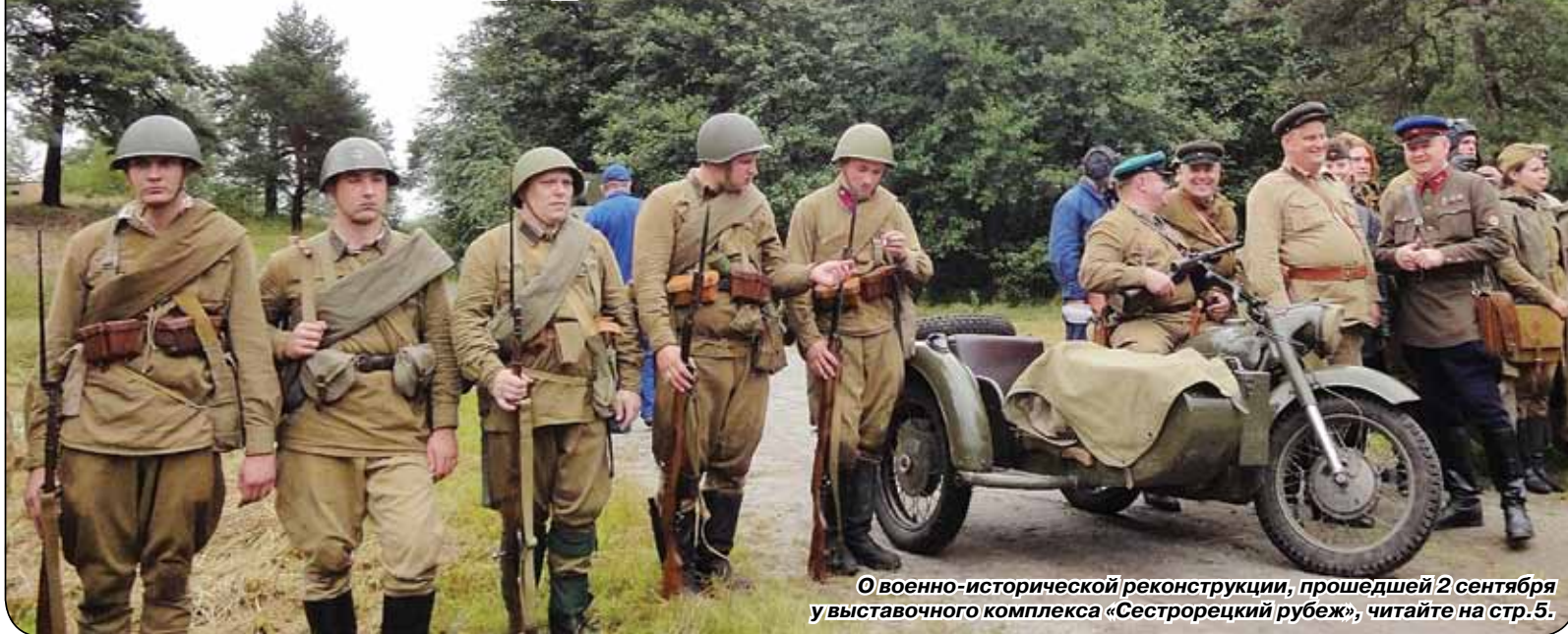
О военно-исторической реконструкции, прошедшей 2 сентября у выставочного комплекса «Сестрорецкий рубеж», читайте на стр.5.

8 сентября исполняется 71 год со дня начала блокады Ленинграда. Стремительно продвигнувшись вглубь страны, к осени 1941-го враг подошел к нашему городу, окружив его в плотное кольцо. С севера к Ленинграду подступили войска Финляндии – союзника Гитлера. Около 900 дней и ночей длилась ленинградская блокада, ставшая одним из самых страшных и героических событий в мировой истории.