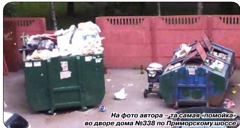
та самая «помойка» во дворе дома №338 по Приморскому шоссе

Уважаемые читатели! Присылайте ваши вопросы, мнения и отклики на публикации по адресу: г. Сестрорецк, Приморское шоссе, д. 280, лит. А или по электронной почте на адрес: zdravnica@mail.ru Редакция