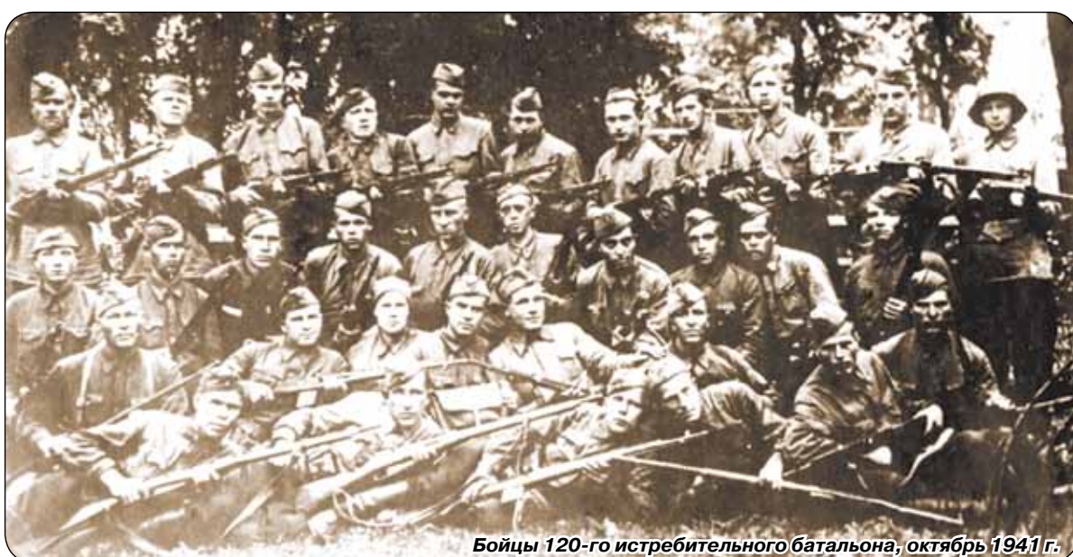
Бойцы 120-го истребительного батальона, октябрь 1941 г.

Огромную роль в том, что враг не прорвался к Ленинграду с севе-