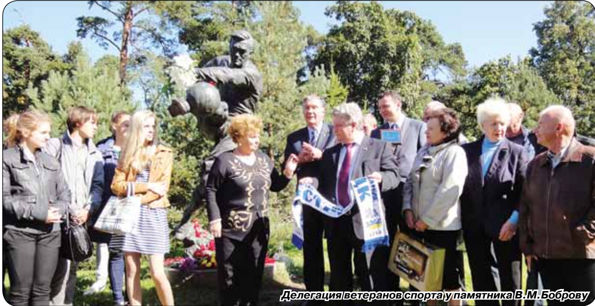
Делегация ветеранов спорта у памятника В.М. Боброву