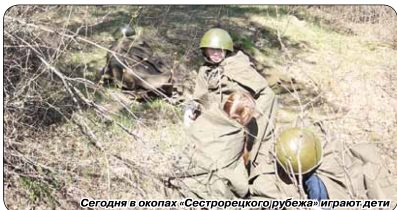
Сегодня в окопах «Сестрорецкого рубежа» играют дети

ра, сыграл именно Сестрорецко-Белоостровский участок Карельского укрепрайона. В 1941 году здесь держали оборону подразделения 106-го и 283-го отдельных пулеметно-артиллерийских батальонов, 120-й истребительный батальон под