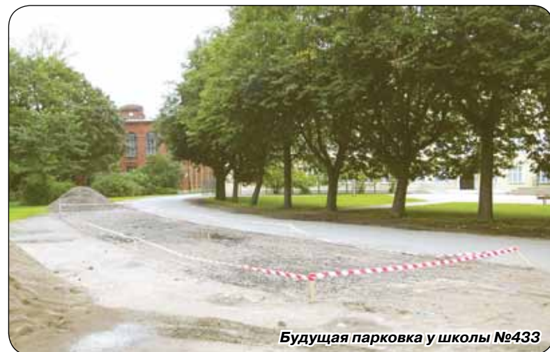
Будущая парковка у школы №433

Спасибо за то, что Вы неравнодушно относитесь к развитию нашего города!