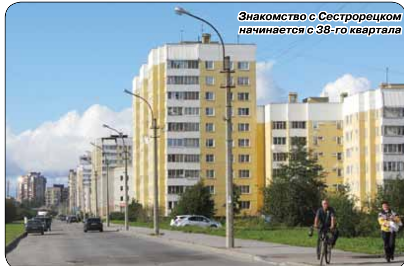
Знакомство с Сестрорецком начинается с 38-го квартала

На фото: так должен был выглядеть 38-й квартал