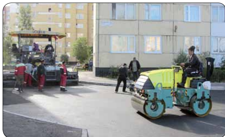
В 38-м квартале продолжают масштабные работы по благоустройству