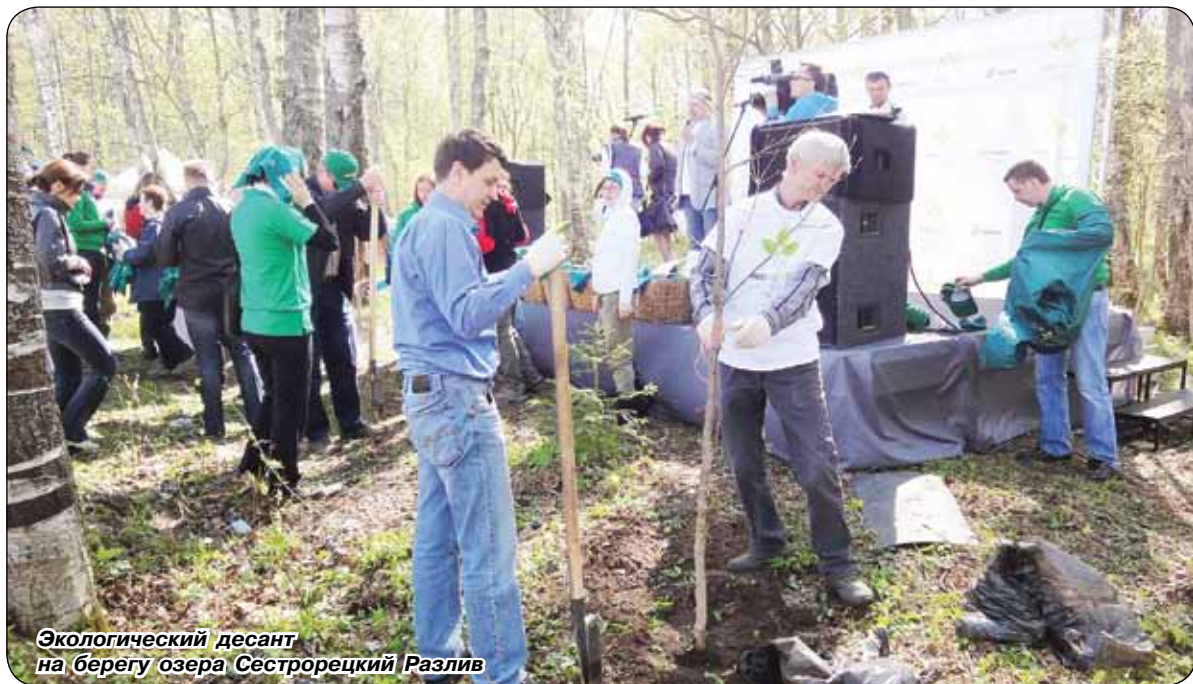
Экологический десант на берегу озера Сестрорецкий Разлив