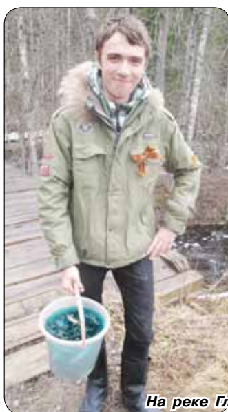
На реке Гладышевке