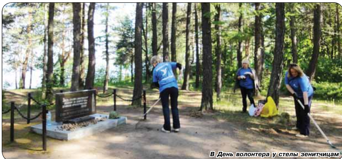
В День волонтера у стелы зенитчикам