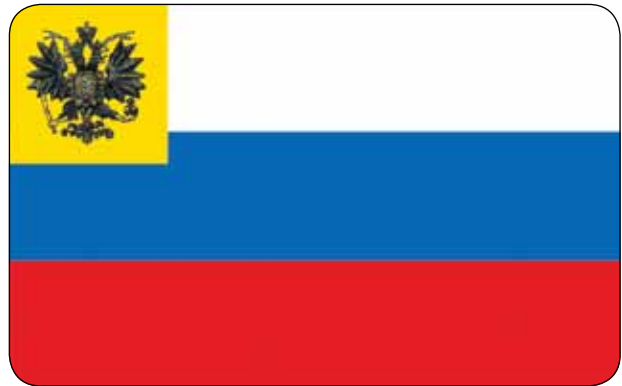
На фото: слева – знамя Петра I, 1700-й год, справа – флаг, высочайше разрешенный к использованию в частном быту, 1914 год