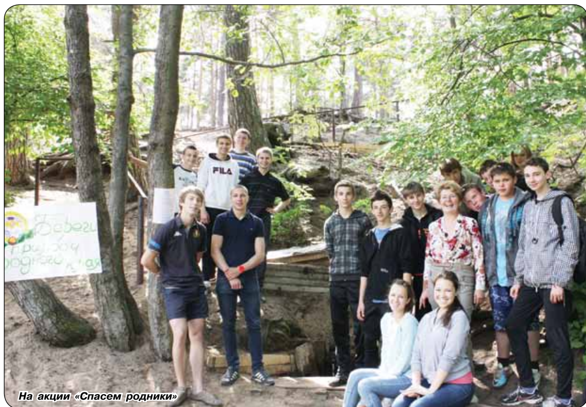
На акции «Спасем родники»