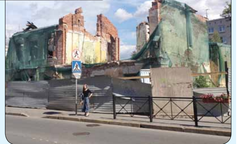
А так оно выглядит в наши дни.