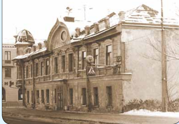
Так здание «старого исполкома» выглядело зимой 1988 года.