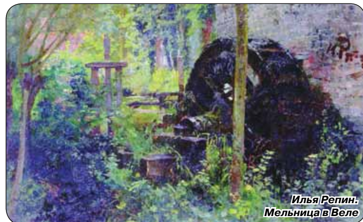
Илья Репин. Мельница в Веле