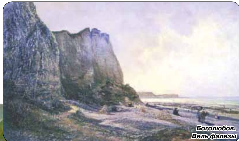
Боголюбов. Вель фалезы