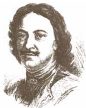
Город Сестрорецк основан в 1714 году Петром I