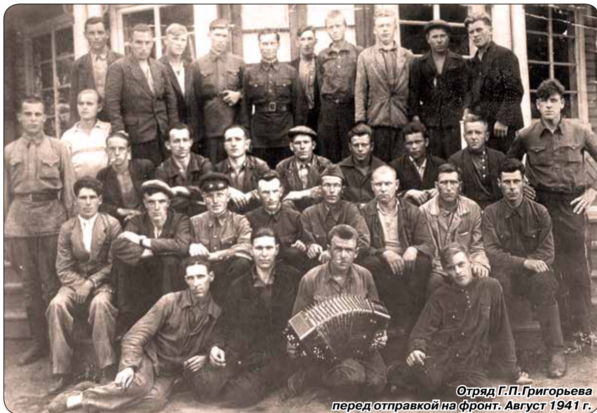
Отряд Г.П.Григорьева перед отправкой на фронт. Август 1941 г.

торый совершил подвиг: ценой своей жизни спас отряд от уничтожения. Герою поставили памятник, а жители города Реджо-Эмилия в Италии выразили в 70-х годах желание стать городом-побратимом Сестрорецка. Был подписан Договор о дружбе между нашими городами, происходил обмен делегациями. Затем, к сожалению, связи эти были утрачены. Сегодня перед краеведами-исследователями стоит задача восстановить эту забытую страницу в истории Сестрорецка.