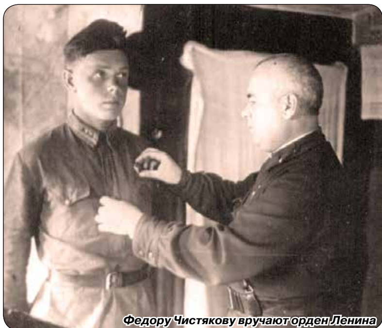
Федору Чистякову вручают орден Ленина