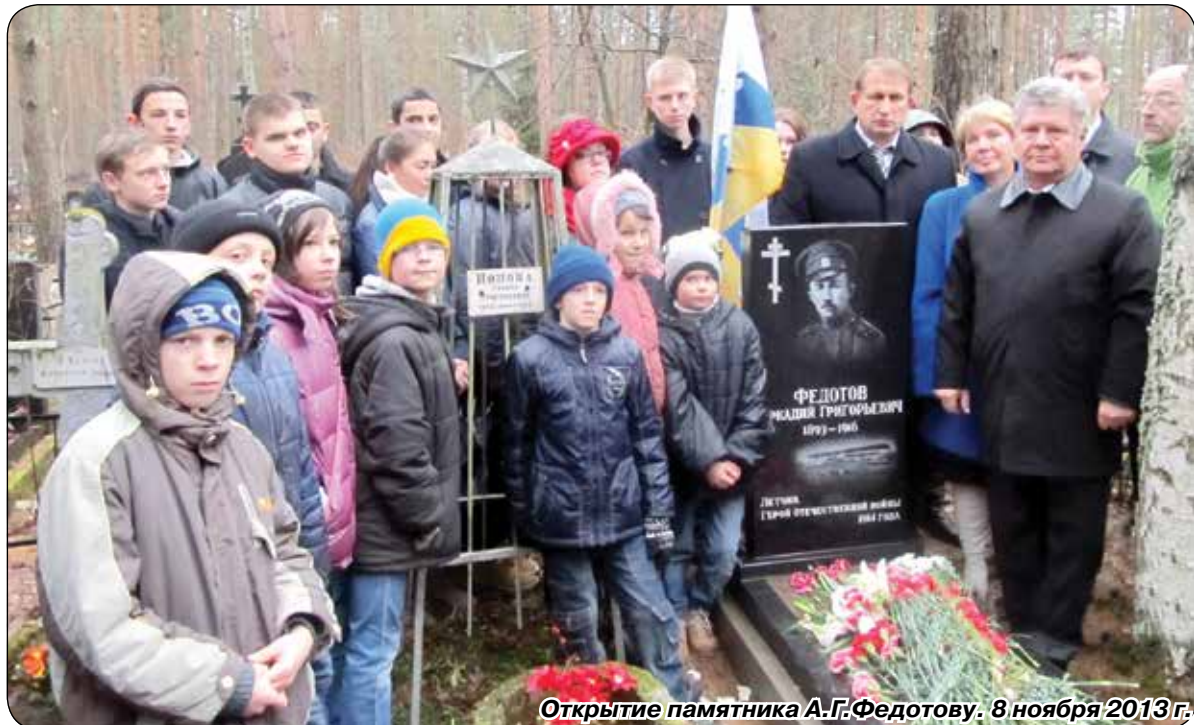
Открытие памятника А.Г.Федотову. 8 ноября 2013 г.