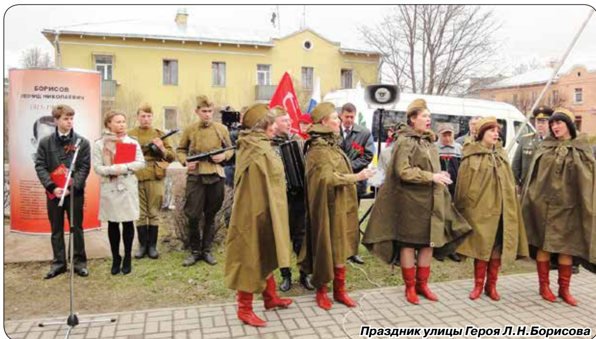
Праздник улицы Героя Л.Н.Борисова