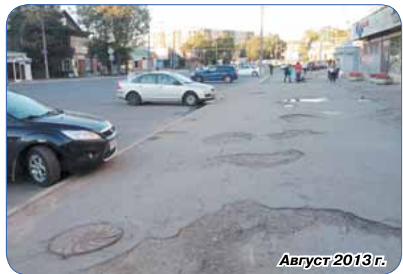
Август 2013 г.