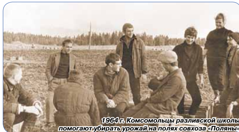
1964 г. Комсомольцы разливской школы помогают убирать урожай на полях совхоза «Поляны»

щены пионерская и комсомольская организации. Взамен пионерии и комсомола появилось множество карликовых общественных организаций – от идеологически бесцветных скаутов до прокремлевского движения «Наши». Но они не идут ни в какое сравнение с комсомолом, который насчитывал более 40 миллионов человек в возрасте от 14 до 28 лет и на самом деле объединял в своих рядах молодежь нашей необъятной страны. Только сегодня очень многие наши руководители поняли, ЧТО мы потеряли с ликвидацией пионерской и комсомольской организаций.