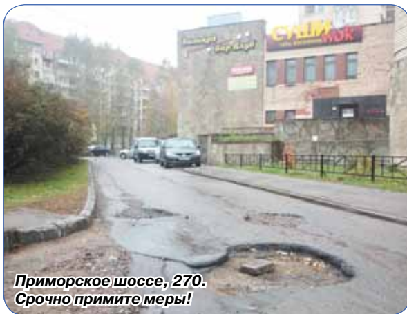
Приморское шоссе, 270. Срочно примите меры!