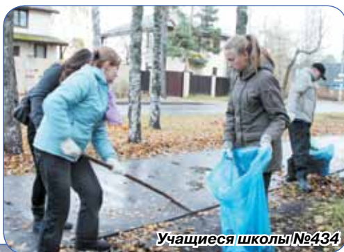
Учащиеся школы №434

всех поколений, в том числе, юные жители. И это не случайно, ведь именно от общих усилий зависят чистота и ухоженность Сестрорецка, уровень комфорта нашей жизни! В этот раз с погодой почти повезло – накануне всю ночь лил проливной дождь, но утром было сухо и временами даже солнечно. Вне зависимо-