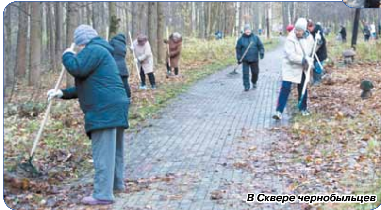
В Сквере черныбыльцев

Муниципальный совет города Сестрорецка объявляет о проведении открытого смотра-конкурса на лучшее украшение предприятий торговли, сферы услуг и общественного питания к празднику Нового года.