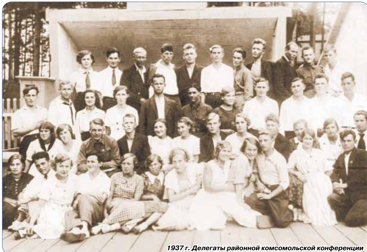
1937 г. Делегаты районной комсомольской конференции