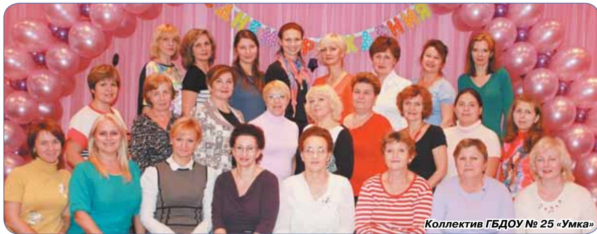
Коллектив ГБДОУ № 25 «Умка»