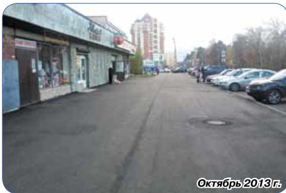
Октябрь 2013 г.