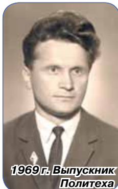
1969 г. Выпускник Политеха