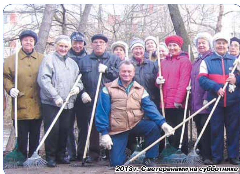
2013 г. С ветеранами на субботнике

Совет ветеранов (пенсионеров) войны, труда, Вооруженных Сил и правоохранительных органов Курортного района