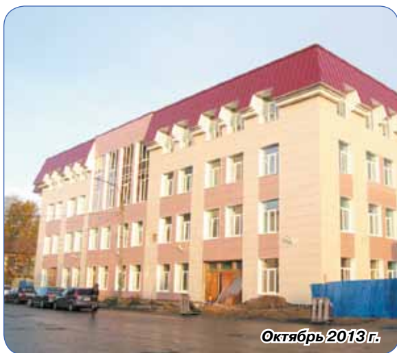
Октябрь 2013 г.