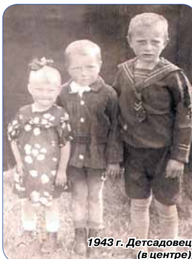
1943 г. Детсадовец (в центре)