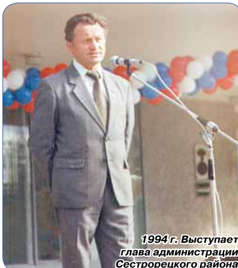
1994 г. Выступает глава администрации Сестрорецкого района

глава администрации Курортного района Санкт-Петербурга