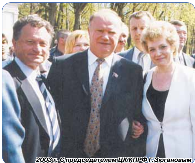
2003 г. С председателем ЦК КПРФ Г. Зюгановым