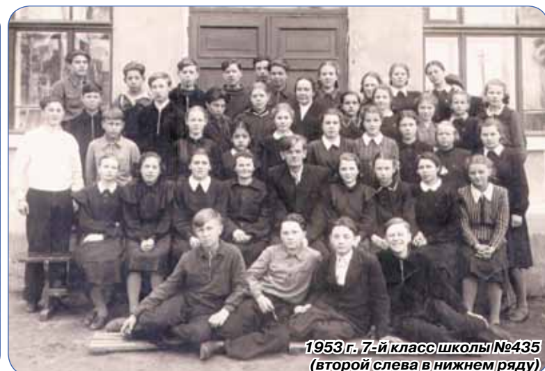
1953 г. 7-й класс школы №435 (второй слева в нижнем ряду)