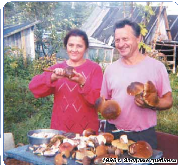
1998 г. Заядлые грибники