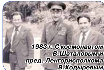
1983 г. С космонавтом В.Шаталовым и пред. Ленгорисполкома В.Ходыревым