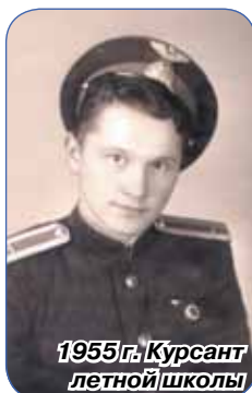
1955 г. Курсант летной школы