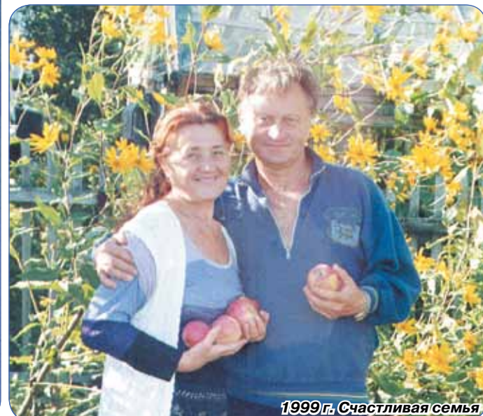
1999 г. Счастливая семья