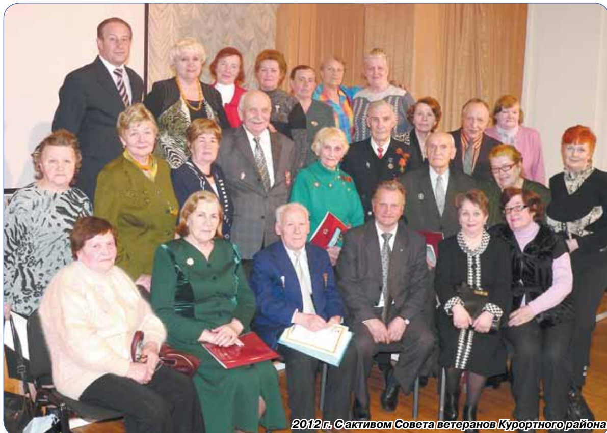
2012 г. С активом Совета ветеранов Курортного района