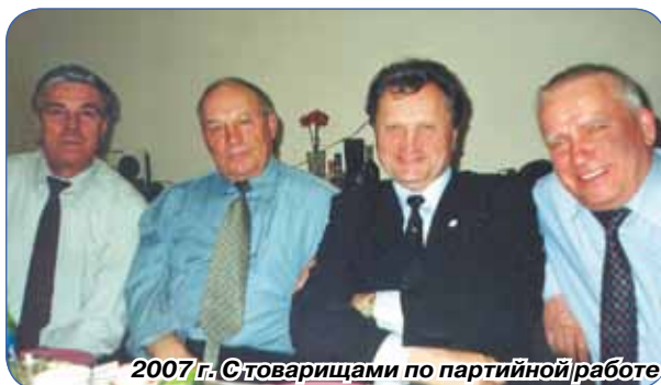
2007 г. С товарищами по партийной работе