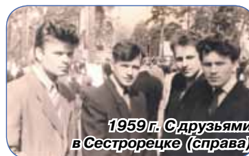
1959 г. С друзьями в Сестрорецке (справа)