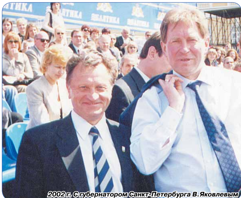
2002 г. С губернатором Санкт-Петербурга В.Яковлевым