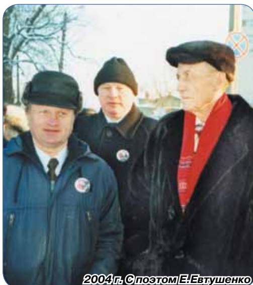
2004 г. С поэтом Е. Евтушенко