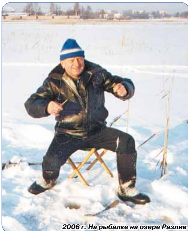
2006 г. На рыбалке на озере Разлив