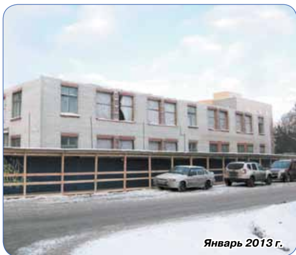
Январь 2013 г.