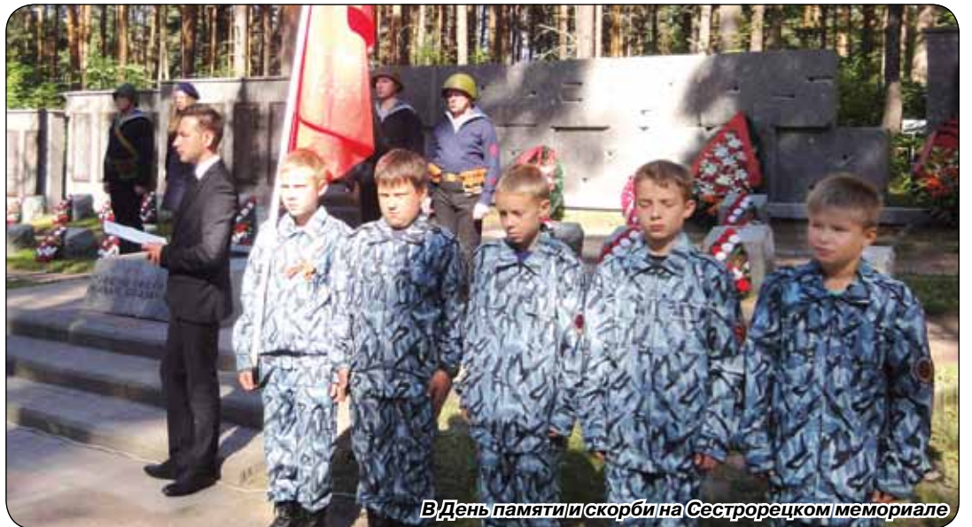
В День памяти и скорби на Сестрорецком мемориале