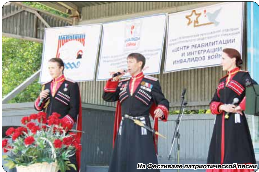
На Фестивале патриотической песни