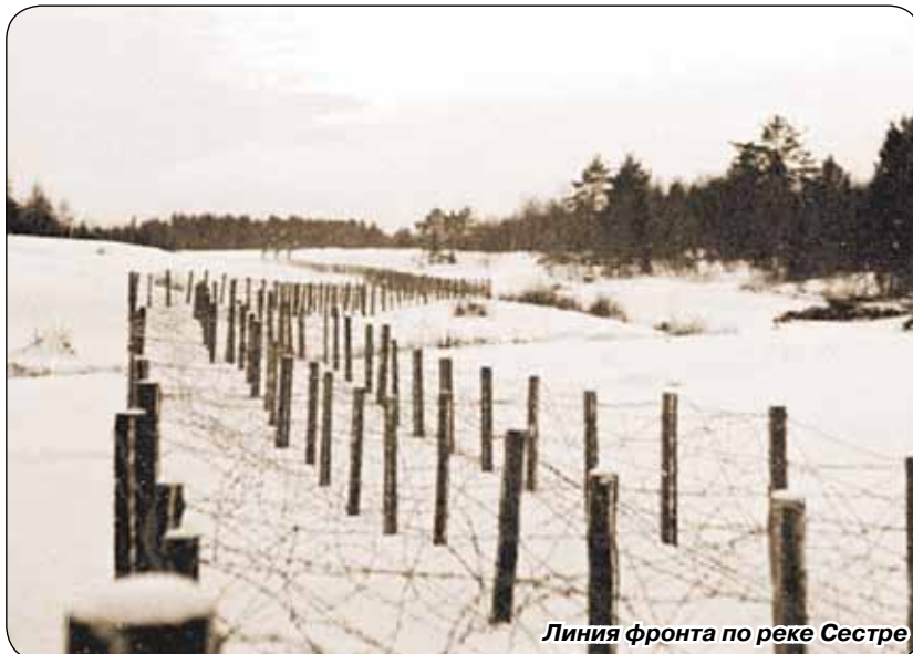
Линия фронта по реке Сестре

22 июня 1941 года. Начало Великой Отечественной войны. День памяти и скорби. Что сегодня помнят граждане нашей страны и жители нашего города об этой дате?