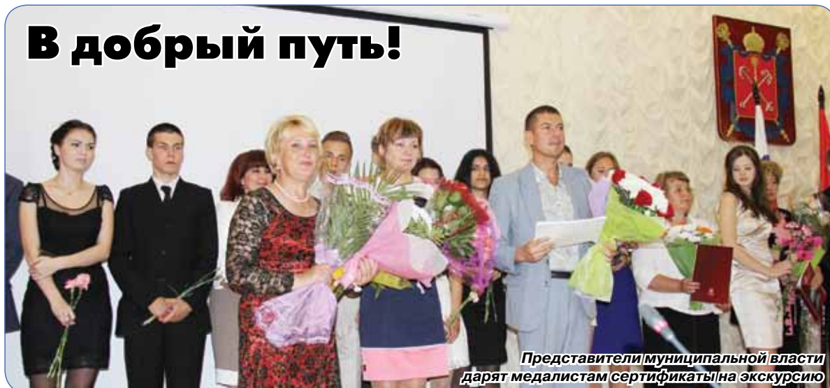
Представители муниципальной власти дарят медалистам сертификаты на экскурсию

21 июня в актовом зале администрации Курортного района состоялась торжественная вручение золотых и серебряных медалей выпускникам школ. В этом году в нашем районе 25 медалистов, в том числе, 15 – из Сестрорецка.