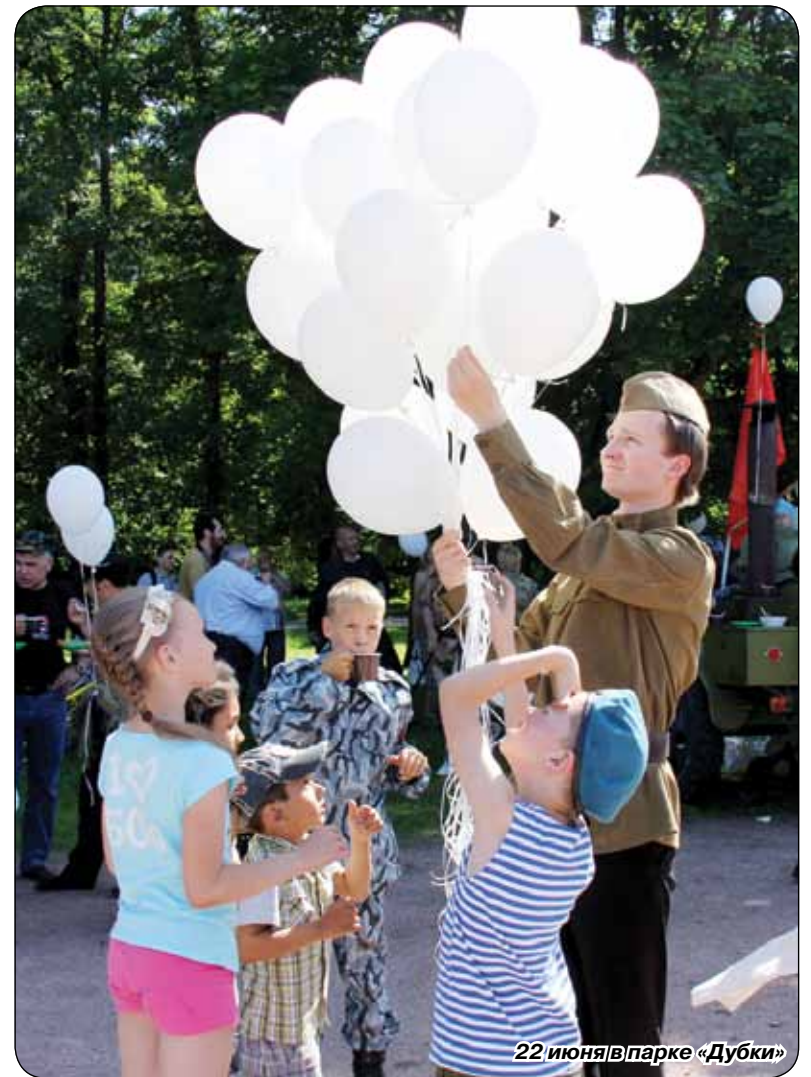
22 июня в парке «Дубки»

В десять утра на сестрорецком мемориальном кладбище собра-