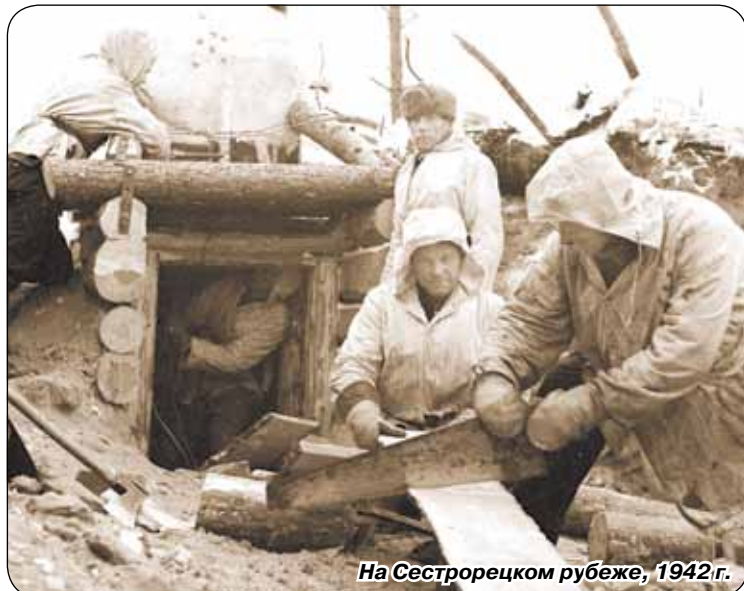
На Сестрорецком рубеже, 1942 г.