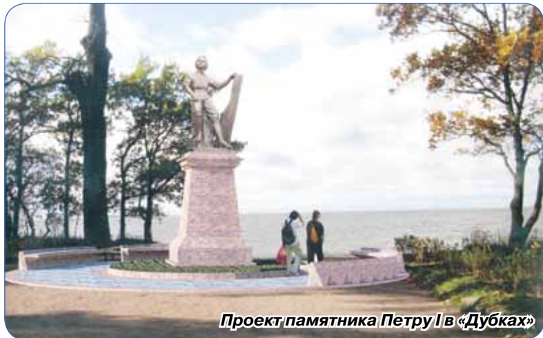
Проект памятника Петру I в «Дубках»