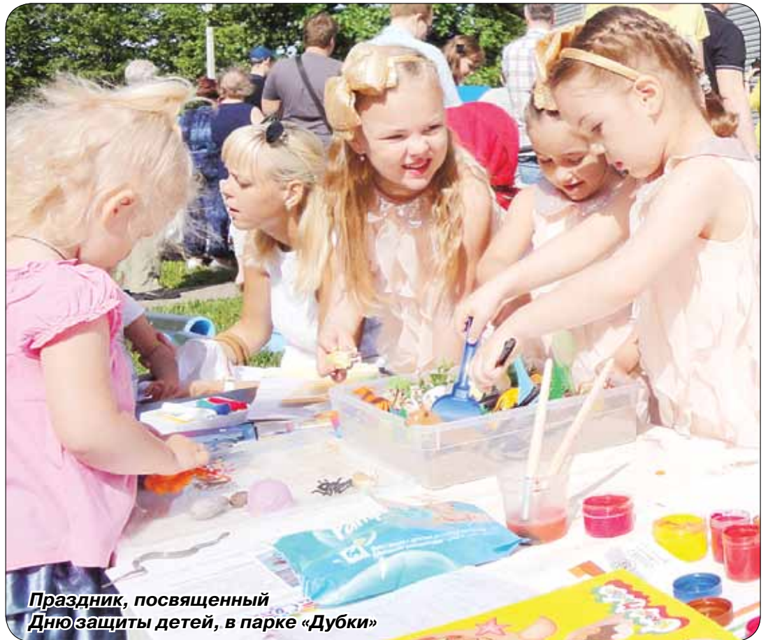
Праздник, посвященный Дню защиты детей, в парке «Дубки»