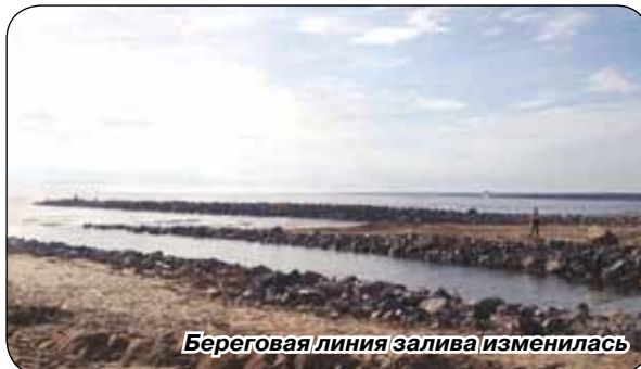
Береговая линия залива изменилась