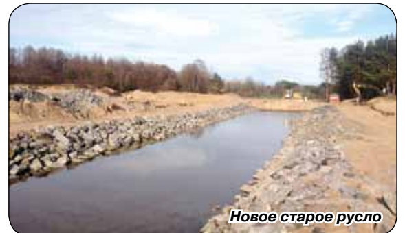
Новое старое русло