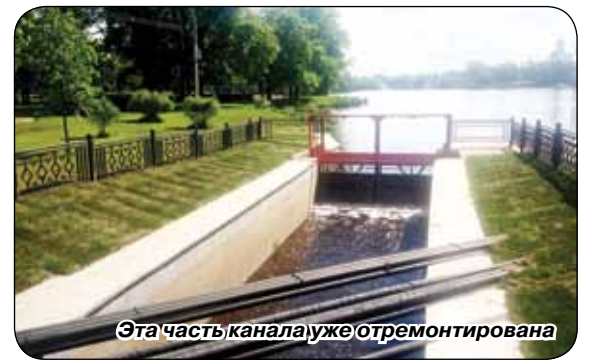
Эта часть канала уже отремонтирована