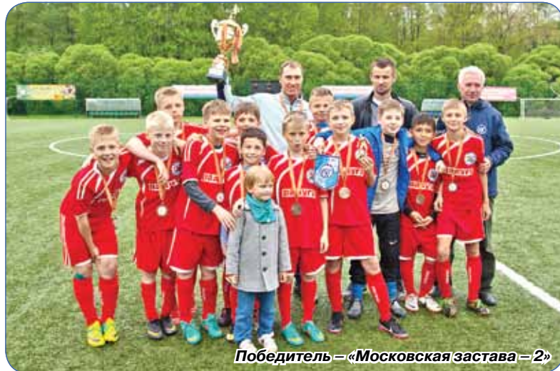
Победитель – «Московская застава – 2»