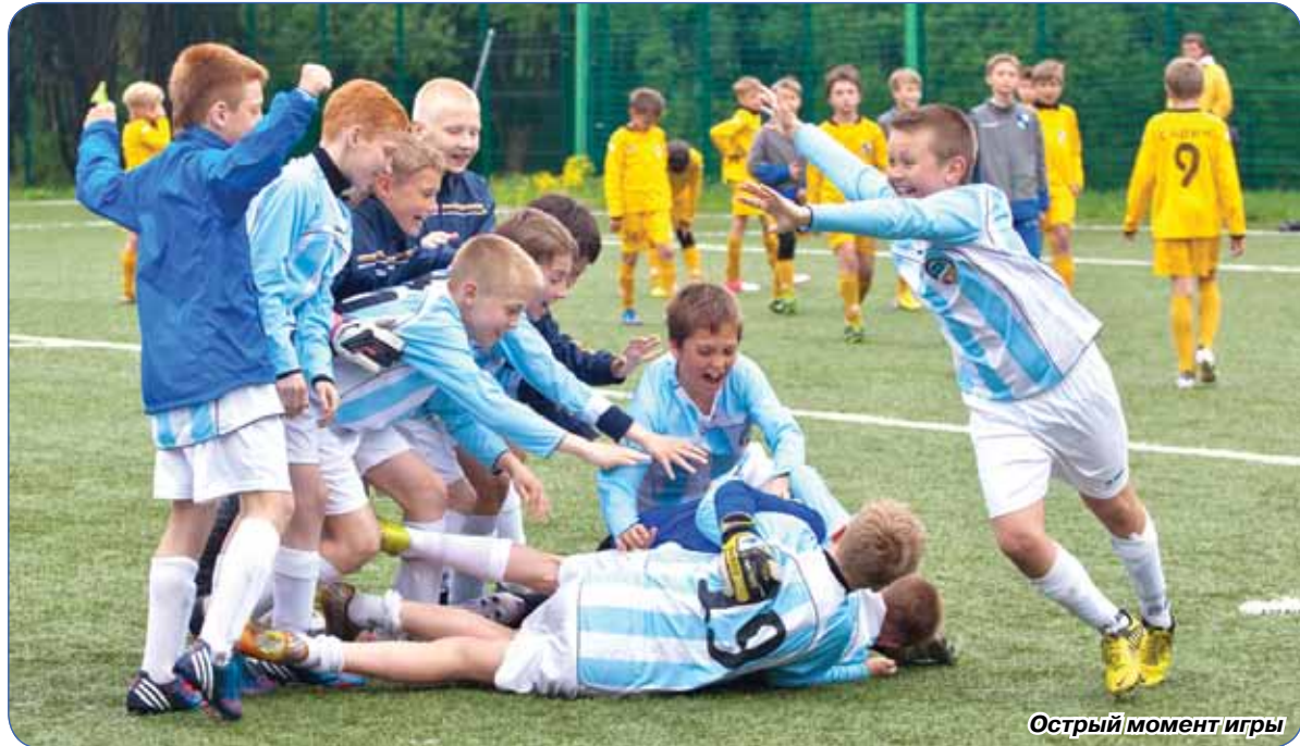
Острый момент игры