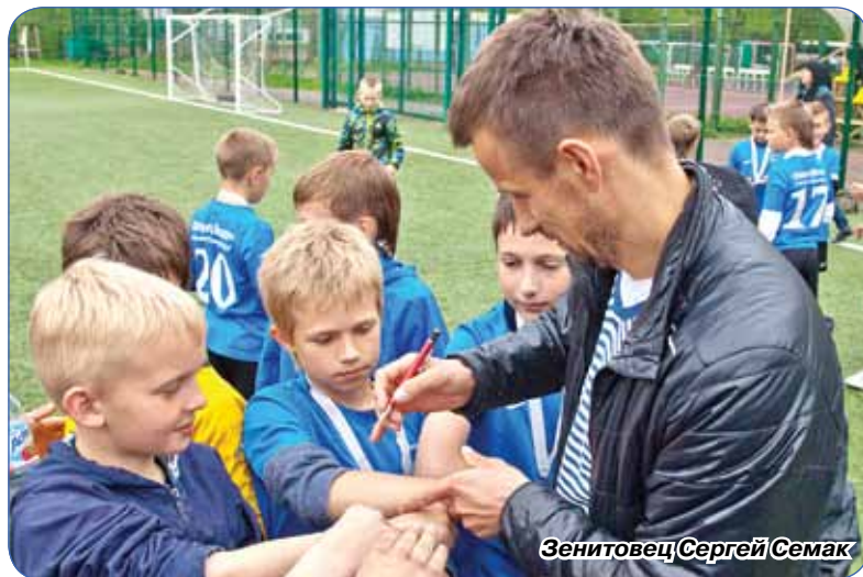
Зенитовец Сергей Семак