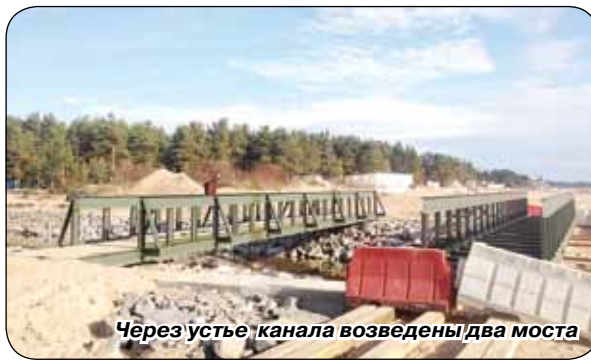
Через устье канала возведены два моста