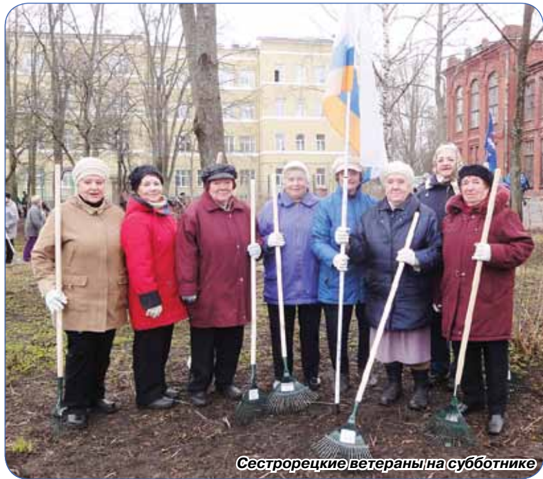
Сестрорецкие ветераны на субботнике

Депутаты Муниципального совета и служащие Местной администрации МО города Сестрорецка