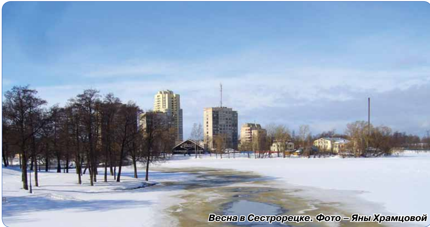
Весна в Сестрорецке.

Природа, а вместе с ней и люди готовятся к приходу тепла, солнечных дней и, конечно же, верят в лучшее. Так устроен человек, что не может он жить без надежды на будущее. Надежды, с одной стороны, на перемены, а с другой – на стабильность.