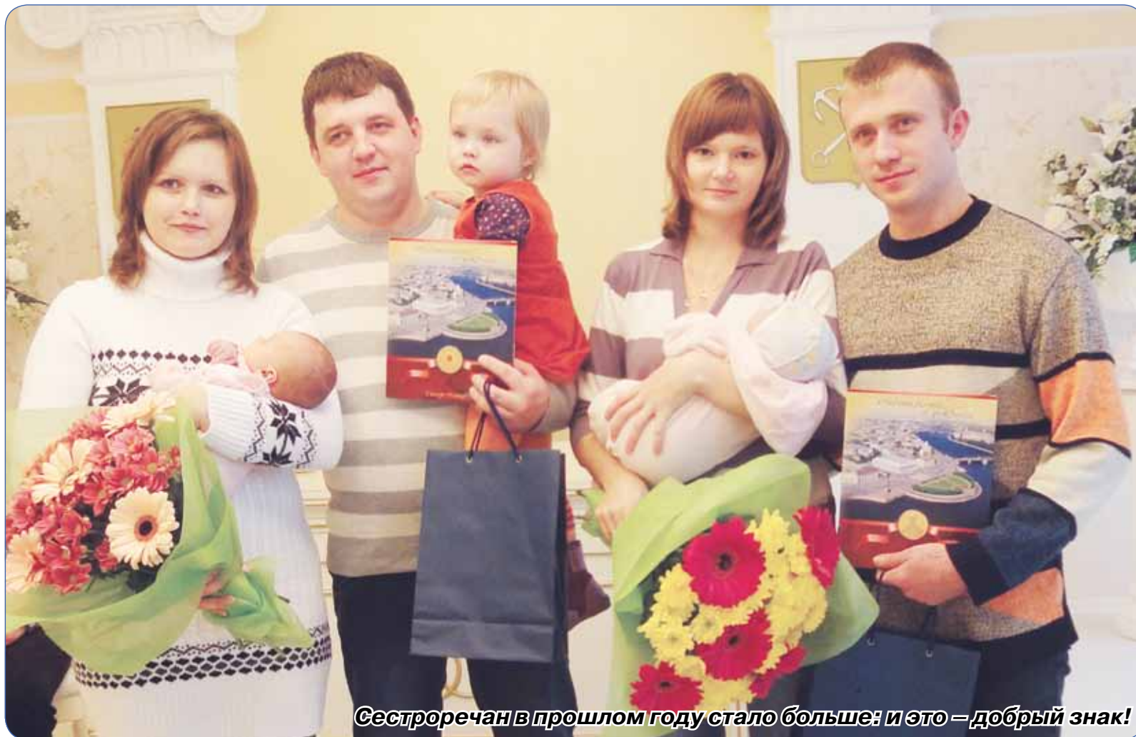
Сестроречан в прошлом году стало больше: и это – добрый знак!

Закончился високосный 2012 год. Он обещал нам конец света, глобальные мировые катаклизмы, взрывы, ураганы, смерчи – как в природе, так и на политической арене и в экономике многих стран мира. Что же на поверку?