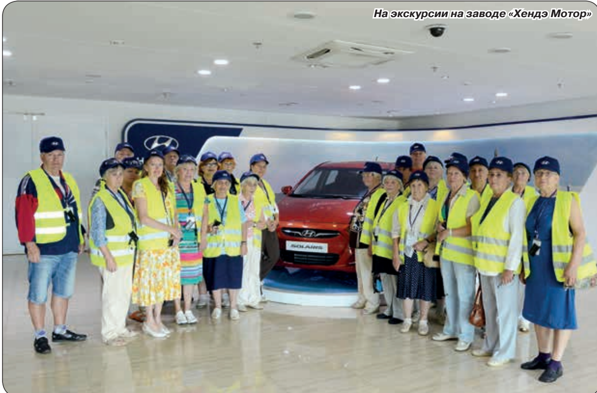
На экскурсии на заводе «Хендэ Мотор»