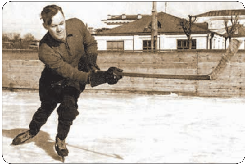
Шаляпин русского футбола, Гагарин шайбы на Руси.

Евгений Евтушенко 1 декабря исполнилось 92 года со дня рождения Всеволода Михайловича Боброва, советского спортсмена, Заслуженного тренера СССР, Заслуженного мастера спорта, Олимпийского чемпиона, который начинал свою спортивную карьеру в Сестрорецке.