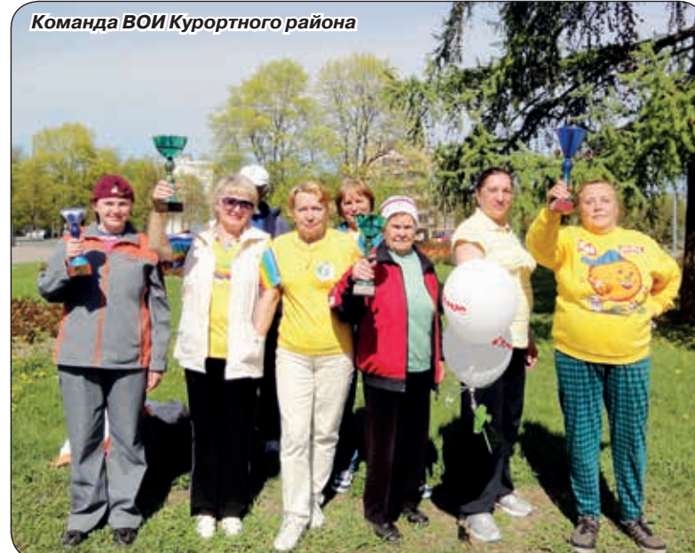
Команда ВОИ Курортного района