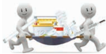
График приёма опасных отходов в Сестрорецке

Адрес стоянки «Экомобиль»: ул.Володарского, д.31