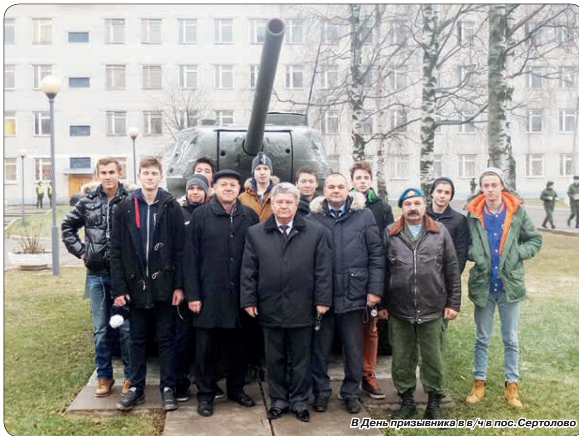
В День призывника в в/ч в пос. Сертолово