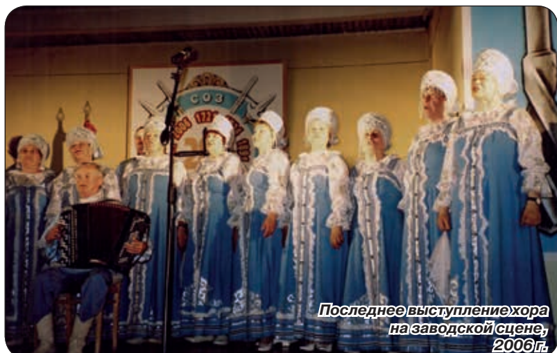
Последнее выступление хора на заводской сцене, 2006 г.