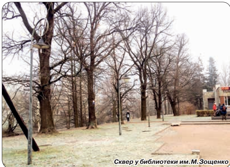
Сквер у библиотеки им.М.Зощенко

20 ноября на своём очередном заседании депутаты Муниципального совета города Сестрорецка среди прочих рассмотрели вопрос о перспективах развития сети уличного освещения.