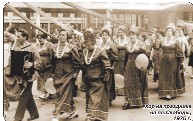
Хор на празднике на пл. Свободы, 1976 г.