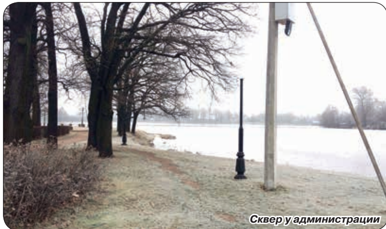
Сквер у администрации