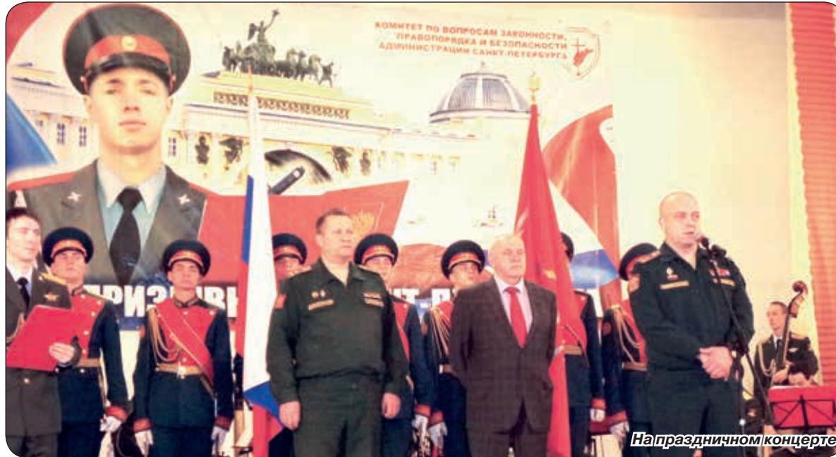
На праздничном концерте