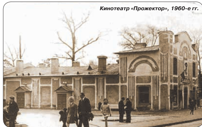
Кинотеатр «Прожектор», 1960-е гг.

ны и пригласили 150 человек мас-совки. Артистов одели в костюмы казаков и изрядно загримирова-