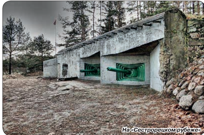
На «Сестрорецком рубеже»

Любовь к Родине – это самоотверженный труд. И наш долг – учить истине молодое поколение. Об этом говорили на выездном пленуме Совета ветеранов Санкт-Петербурга, который проходил в Курортном районе 30 октября. Представители ветеранских организаций всех районов Санкт-Петербурга собрались в Сестрорецке, чтобы не только обсудить текущие вопросы деятельности этой одной из самых старейших и уважаемых в городе организаций, но и воочию