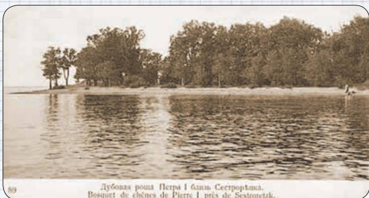
Дубовая роща Петра I близ Сестрорецка. Bosquet de chênes de Pierre I près de Sestroretsk.

В лучшем городе нашей земли, в Сестрорецке.