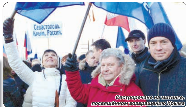
Сестрорецкчане на митинге, посвящённом возвращению Крыма

Депутаты Муниципального совета города Сестрорецка на своём заседании приняли решение обратиться через коллег-депутатов к жителям Крыма с предложением о сотрудничестве и установлении побратимских связей. Публикуем текст этого обращения.