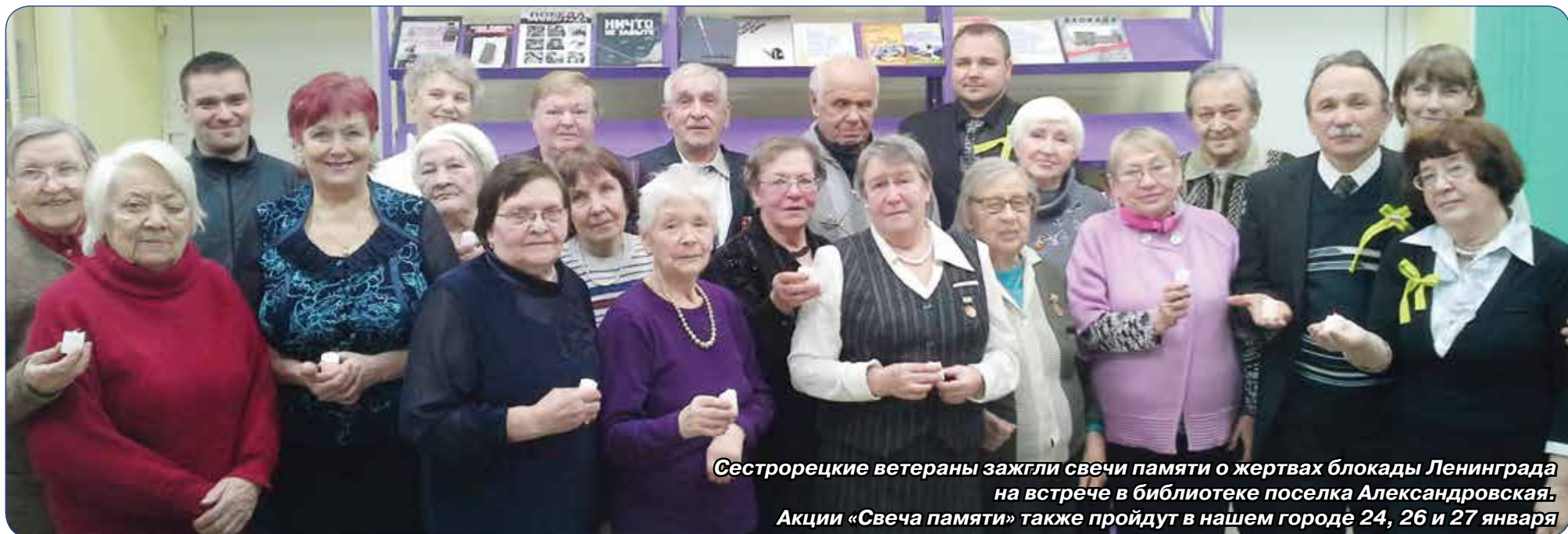
Сестрорецкие ветераны зажгли свечи памяти о жертвах блокады Ленинграда на встрече в библиотеке поселка Александровская. Акции «Свеча памяти» также пройдут в нашем городе 24, 26 и 27 января