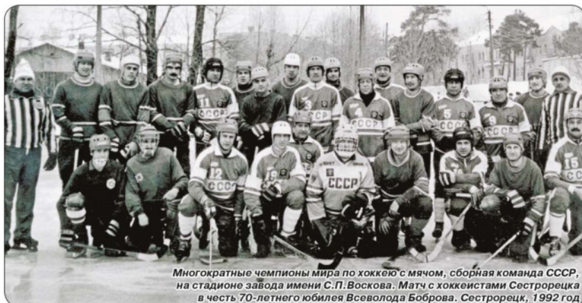
Многочисленные чемпионы мира по хоккею с мячом, сборная команда СССР, на стадионе завода имени С.П.Воскова. Матч с хоккеистами Сестрорецка в честь 70-летнего юбилея Всеволода Боброва. Сестрорецк, 1992 год