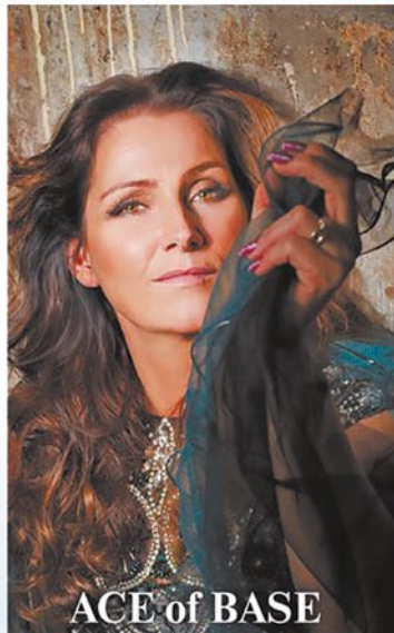
ACE of BASE