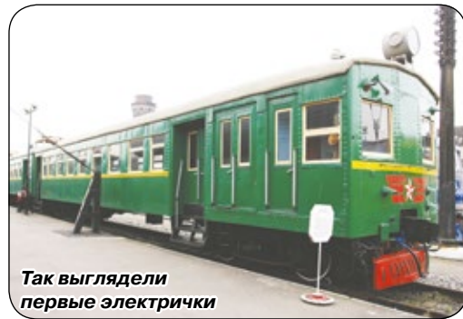
Так выглядели первые электрички

ния, салон – с деревянными лакированными лавками. С началом электрификации произошли и другие изменения: построены более высокие платформы, уложены новые рельсы и оборудованы стрелочные переводы, введена автоматизация, охраняемые и со световой сигнализацией переезды, построены