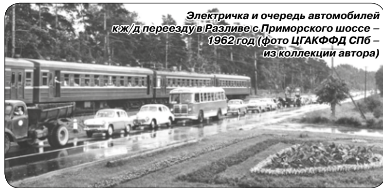
Электричка и очередь автомобилей к ж/д переезду в Разливе с Приморского шоссе – 1962 год