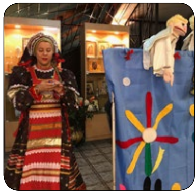
В Доме Культуры и Творчества Курортного района прошёл XIII Районный Пасхальный фестиваль.