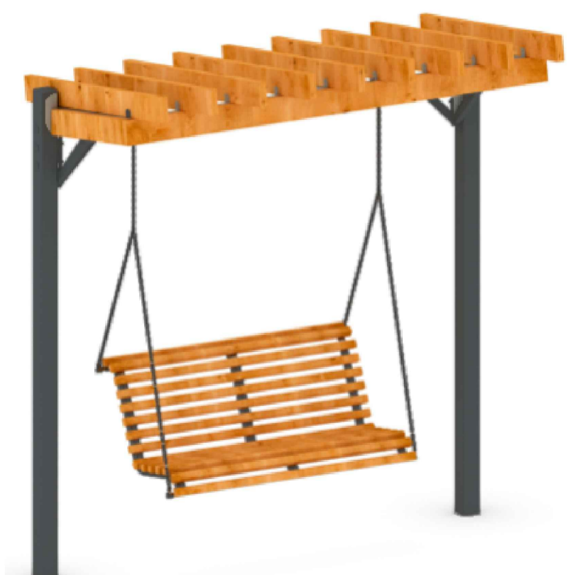
Оборудование для зоны общего пользования