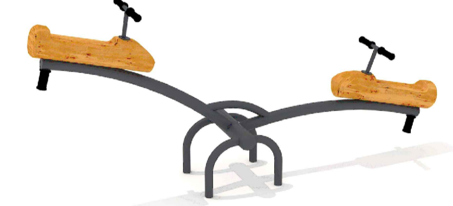
Зона общего пользования