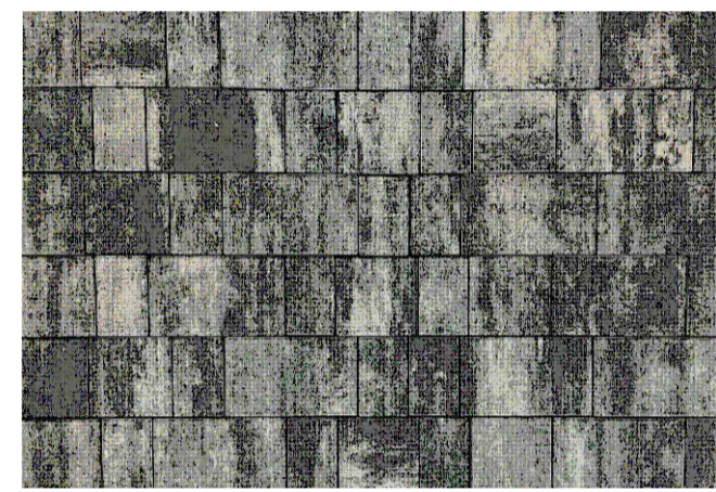
Мощение с плиточным покрытием проектируемое