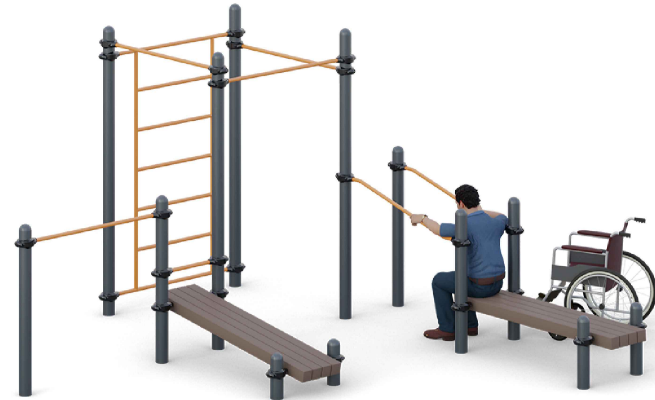
Комплекс Воркаут, наклонные брусья, турники