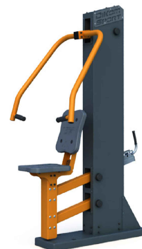
Тренажер "Жим" с изменяемой нагрузкой