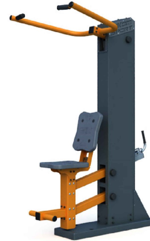
Тренажер "Вертикальная тяга" с изменяемой нагрузкой