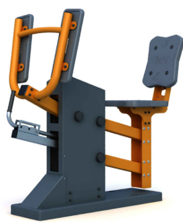
Тренажер "Жим ногами" с изменяемой нагрузкой