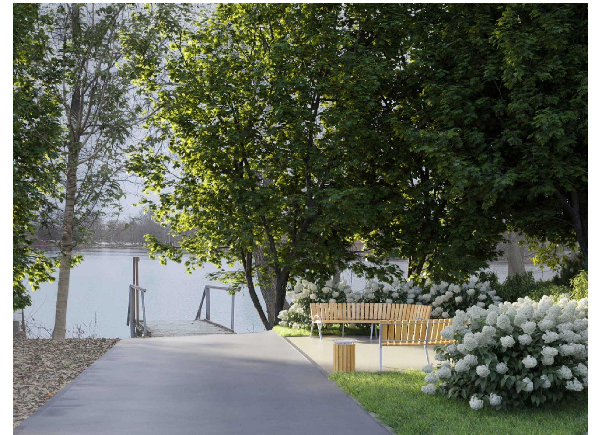
Зона общего пользования