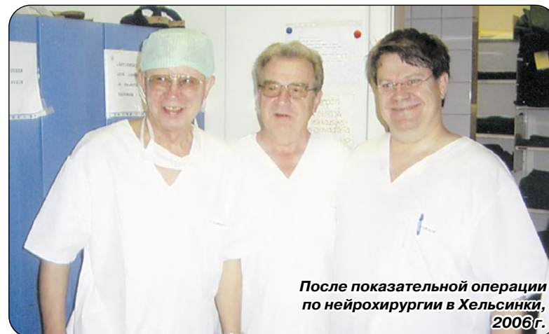
После показательной операции по нейрохирургии в Хельсинки, 2006 г.