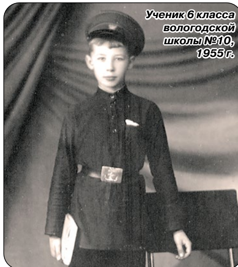
Ученик 6 класса вологодской школы №10, 1955 г.