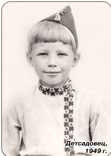
Детсадовец, 1949 г.

Руководство и сотрудники СПб ГБУЗ «Городская больница №40» Служащие отдела здравоохранения администрации Курортного района СПб