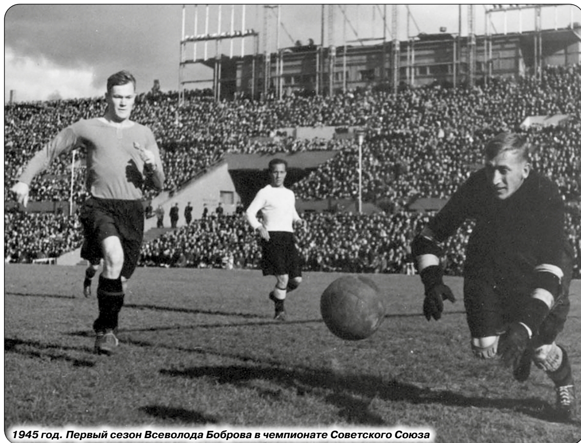
1945 год. Первый сезон Всеволода Боброва в чемпионате Советского Союза

работает филиал футбольной академии «Зенит-Сестрорецк», в котором успешно занимаются десятки юных жителей. Ежегодно мы проводим Международный детский турнир по футболу «Кубок Всеволода Боброва» и другие яркие спортивные мероприятия.