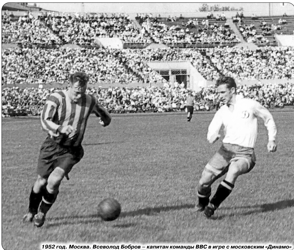
1952 год. Москва. Всеволод Бобров – капитан команды ВВС в игре с московским «Динамо»