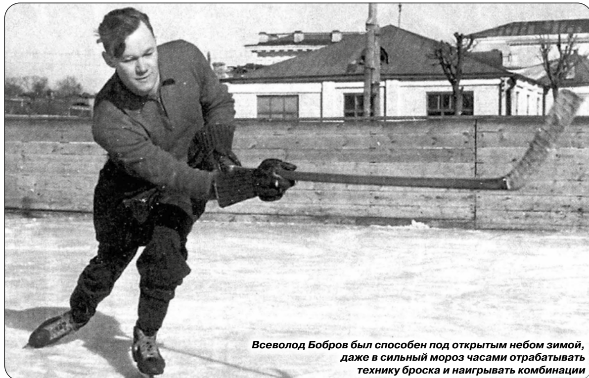
Всеволод Бобров был способен под открытым небом зимой, даже в сильный мороз часами отрабатывать технику броска и наигрывать комбинации

но играл Запрягаев, но на 80-й минуте он вновь был бессилен после удара Боброва, забившего 30-й гол в сезоне. В дальнейшем счёт 2:0 не изменился, и армейцы второй год подряд совершили с Кубком круг почёта на Малом стадионе «Динамо».