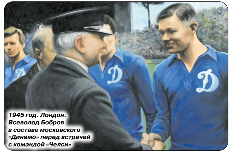
1945 год. Лондон. Всеволод Бобров в составе московского «Динамо» перед встречей с командой «Челси»