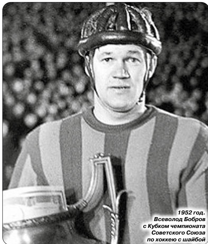
1952 год. Всеволод Бобров с Кубком чемпионата Советского Союза по хоккею с шайбой

В футбольном сезоне 1948 года Всеволод Бобров в 17 играх чемпи-