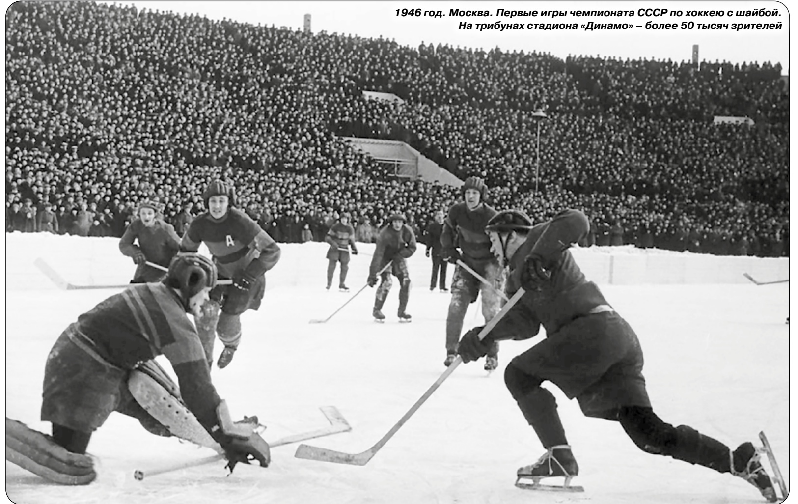
1946 год. Москва. Первые игры чемпионата СССР по хоккею с шайбой. На трибунах стадиона «Динамо» – более 50 тысяч зрителей