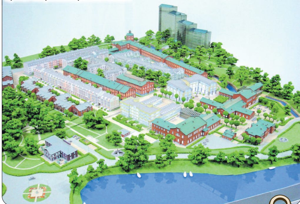
Проект «Петровский Арсенал». 2008 г.