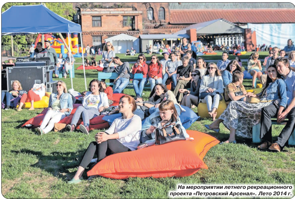
На мероприятии летнего рекреационного проекта «Петровский Арсенал». Лето 2014 г.